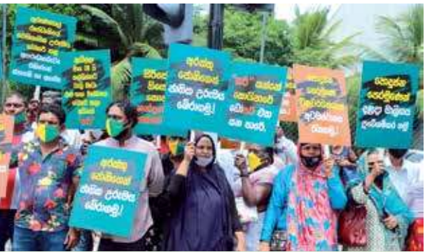
குருநாகலில் அமைந்துள்ள இரண்டாம் புலன்கைபாகு மன்னனின் ராஜ்ய சபையை இடித்தமைக்கு எதிர்ப்புத் தெரிவித்து நேற்று ஐக்கிய மக்கள் சக்தியின் உறுப்பினர்கள் விட்டன் சுற்றுலாத்தலத்தில் ஆர்ப்பாட்டத்தில் ஈடுபட்டபோது...