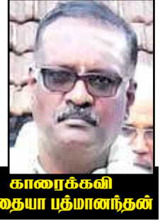
காரைக்கனி கந்தையா பத்திரிகை