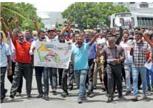
கொழும்பு துறைமுகத்தின் கிழக்கு முனையத்தை வெளிநாட்டுக்கு கொடுப்பதற்கு எதிர்ப்புத் தெரிவித்து கிழக்கு முனையத்தைப் பாதுகாப்பதற்கான தொழிற்சங்க ஒன்றியத்தின் போராட்டத்தை மக்கள் மயப்படுத்தும் நிகழ்வு நேற்று கொழும்பு துறைமுகத்தின் முன்னால் இடம்பெற்றது. இதில் எல்லோருமும் கணவங்க சேரர் பங்குபற்றியிருந்தமை குறிப்பிடத்தக்கது.