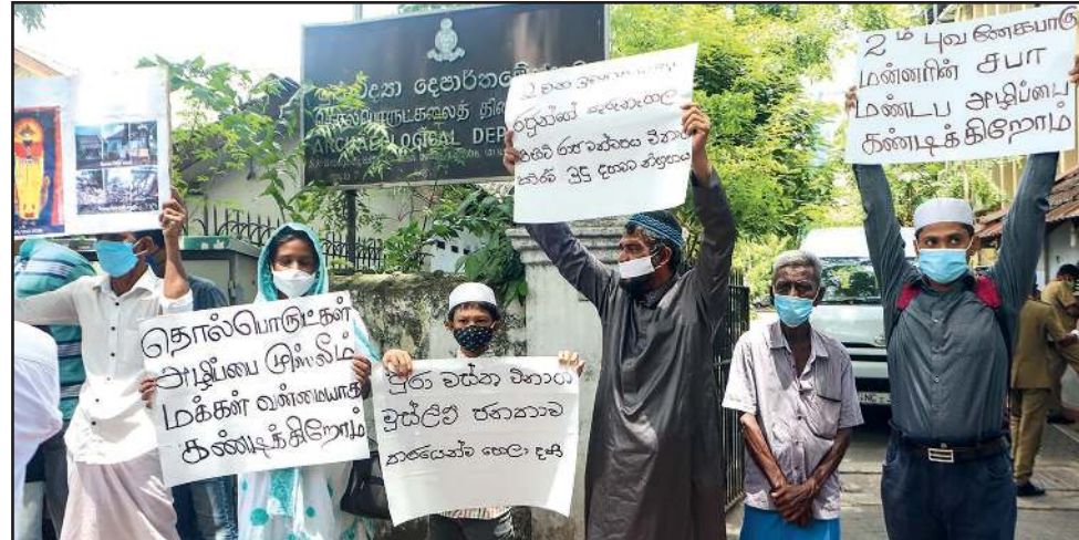
புவனேகபாகுவின் ராஜ்ய சபை மண்டபம் குருநாகலில் இடிக்கப்பட்ட சம்பவத்தை கண்டித்து வடக்கு கிழக்கு முஸ்லிம் உரிமைகளை பாதுகாக்கும் அமைப்பு நேற்று கொழும்பிலுள்ள தொல்பொருள் திணைக்களம் முன் ஆர்ப்பாட்டமொன்றை நடத்தியது.

நபர்களை ஆலோசனை வகுப்புகளுக்கு அனுப்பி வைக்கவுள்ளதாக பொலிஸ் தலைவர்கள் தெரிவிக்கின்றனர். இவர்களில் 435 பேர், கடந்த 11ஆம் திகதி பொலிஸ் துறை சார்ந்த படையின் தலைமையகத்தில் இடம்பெற்ற ஆலோசனை வகுப்புக்கு அனுப்பிவைக்கப்பட்டுள்ளமை குறிப்பிடத்தக்கது. பொலிஸாரால் எச்சரிக்கப்பட்டு விடுவதற்கு ஏனையவர்கள் எதிர்வரும் நாட்களில் படிப்படியாக ஆலோசனை வகுப்புகளுக்கு அனுப்பி வைக்கப்படுவார்கள் என்று பொலிஸ் தலைமையகம் தெரிவித்துள்ளது. கொவிட் - 19 நோய்த்தொற்றை ஒழிப்பதற்காக முக்கவசம் அணிதல்