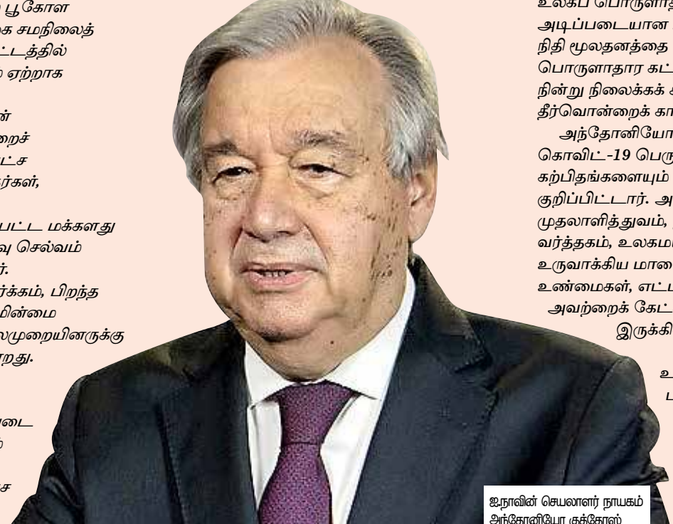
ஜ.நா. செயலாளர் நாயகம் அந்தோனியோ குத்தேரஸ்

தமிழ்த் தேசியம், தமிழ்ச் சமூகத்தின் அகமுரண்பாடுகள் குறித்துப் பேசுவோ, அக்கறை கொள்ளவோ தயாராக இல்லை என்பதை, கடந்த ஒரு நூற்றாண்டுகால வரலாறு காட்டி நிற்கின்றது. இன்று ஒடுக்கப்பட்ட தமிழ் மக்கள், தமிழ்த் தேசிய கட்சிகளைப் புறக்கணித்து, தனியே புதிய பாடையில் பயணப்படத் தொடக்கிவிட்டார்கள். இது நல்லதொரு தொடக்கம்.