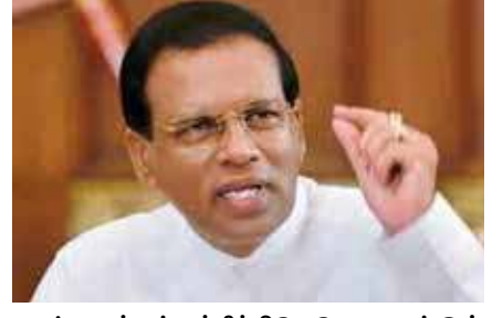
பெற்ற மக்கள் சந்திப்பிலேயே, அவர் இவ்வாறு தெரிவித்தார்.

ஓகஸ்ட் மாதம் 5 ஆம் திகதி நடைபெறவுள்ள தேர்தலின் முடிவைத் தான் இப்போதே கூறுகிறார் எனத் தெரிவித்த முன்னாள் ஜனாதிபதி மைத்திரிபால சிறிசேன, தாம் ஒன்றரை லட்சத்துக்கும் அதிகப்படியான மேலதிக வாக்குகளைப்பெற்று, தேர்தலில் வெற்றிபெறவுள்ளார் எனத் தெரிவித்தார்.