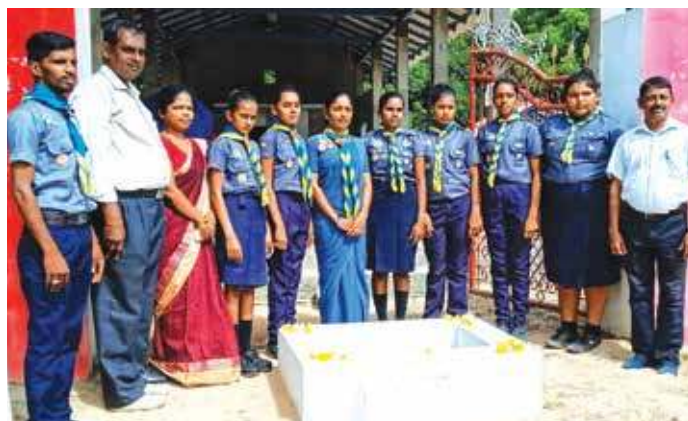
கிளி. இந்துக் கல்லூரி மாணவியால்

சவுதி அரேபியாவிலிருந்து நாடு திரும்பி, தனிமைப்படுத்தல் நிலையத்தில் வைக்கப்பட்டிருந்த ஒருவரே இவ்வாறு புதிய தொற்றாளராக அடையாளம் காணப்பட்டுள்ளார். இந்த நிலையில் நாட்டின் தற்போதைய மொத்த கொரோனா தொற்றாளர்களின் எண்ணிக்கை 2,753 ஆக அதிகரித்துள்ளது. (ரி2)