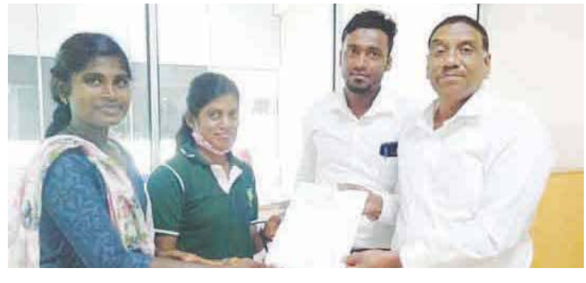
பாசப்பறவைகள் இளைஞர் அமைப்பை கிளிநொச்சி மாவட்டத்தில் உத்தியோகபூர்வமாக அண்மையில் பதிவுசெய்து உறுதிப்படுத்திய சான்றிதழை, உதவித் திட்டமிடல் பணிப்பாளரிடம் அமைப்பின் தலைவர், செயலாளர் ஆகியோர் பெற்றுக்கொண்டனர். இந்த அமைப்பானது 2018ம் ஆண்டிலிருந்து கிளிநொச்சி மாவட்ட இளைஞர், யுவதிகளின் பங்களிப்புடன் எந்தவித இலாப நோக்கமும் இன்றி சேவையைச் செய்துவருகின்ற முன்மாதிரியான இளைஞர் அமைப்பு எனக் கூறப்படுகிறது. (ரி3)

அம்பாறையிலிருந்து கொழும்பு நோக்கிப் பயணித்த தனியார் பஸ் கண்டி, தெல்தெனிய பகுதியில் திடீரென்று தீப்பற்றி எரிந்ததால் பெரும் பரபரப்பு ஏற்பட்டது. அதில் பயணித்த பயணிகள் அவசர அவசரமாக இறக்கப்பட்டு காயங்களின்றி காப்பாற்றப்பட்டனர். சம்பவம் நேற்று இரவு 7.45 அளவில் இடம்பெற்றுள்ளது. பொலிஸார் மற்றும் கண்டி மாநகர சபையின் தீயணைப்பு பிரிவு அதிகாரிகள் இணைந்து தீயைக் கட்டுப்படுத்தினர். தீப்பரவலுக்கான காரணம் கண்டறியப்படவில்லை. தெல்தெனிய பொலிஸார் விசாரணை மேற்கொண்டனர். (து)