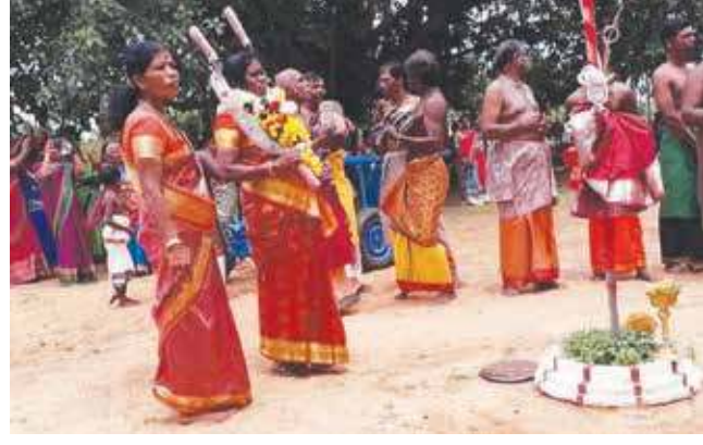
மிருசுவில் ஸ்ரீஞானதுர்க்கை அம்மன் தேவஸ்தான அலங்கார உற்சவம் 10 தினங்களாக நடைபெற்று, கடந்த வியாழக்கிழமை தேர்த் திருவிழா இடம்பெற்றது. (ரி2-159).

கொள்கலன் பெட்டி கடத்தல்; கிராம சேவகரால் முறியடிப்பு!