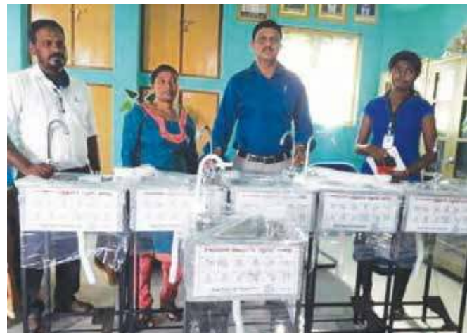
ஓபர் நிறுவனத்தினால் கிளிநொச்சி பிரமந்தனாறு மகா வித்தியாலயத்துக்கு ஏழு கை கழுவும் இயந்திர பொறிகள் வழங்கப்பட்டுள்ளன.

மேலும், இத் திட்டத்திற்காக கொவிட்19 தொற்றின் காரணமாக தொழில் பாதிப்புற்ற கடன்பெற்ற பயனாளிகளின் விபரங்களை கிராம அலுவலர் பிரிவுகளின் சமுர்த்தி உத்தியோகத்தர்கள் திரட்டி வருகின்றனர் எனவும் சமுர்த்திப் பிரிவினர் தெரிவித்துள்ளனர். (ரி3-39)