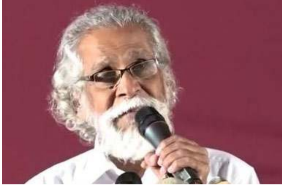
அது நல்ல விடயம்தான்.

வாக்குகள் மூலம் அதைச் செய்து காட்ட அழைக்கிறார் சட்டத்தரணி சிறீகாந்தா