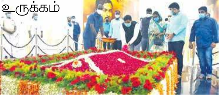
இராமேசுவரம் அடுத்தள்ள பேய்க்குப்பு கிராமத்தில் குடியரசு முன்னாள் தலைவர் ஏ.பி.ஜே.அப்துல் கலாம் தேசிய நினைவிடத்தில் அவரது குடும்பத்தினர் மலர் தூவி அஞ்சலி செலுத்தியபோது....

முறைந்த முன்னாள் இந்திய குடியரசுத் தலைவர் அப்துல் கலாமின் 5ஆம் ஆண்டு நினைவு தினத்தை முன்னிட்டு நடிகர் விவேக் டுவீட்டில் உருக்கமாக பதிவிட்டுள்ளார். விண்வெளி, அறிவியல், நிர்வாகம் மற்றும் கல்வி உள்ளிட்ட பல்வேறு துறைகளில் இமாலய சாதனைகளை படைத்தவர் ஏ.பி.ஜே. அப்துல் கலாம். இவர் கடந்த 2015ஆம் ஆண்டு ஜூலை 27ஆம் திகதி மேகாலயா மாநிலத் தலைநகரான ஷில்லாங்கில் இந்திய மேலாண்மை கல்வி நிறுவனத்தில் மாணவர்களிடையே உரையாற்றுகையில் திடீரென்று மயங்கி விழுந்து இறந்தார். நேற்று அவரது 5ஆம் ஆண்டு நினைவுதினம் கடைப்பிடிக்கப்பட்டது. இந்நிலையில்,