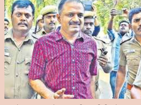
சுமார் 28 வருடங்களாக சிறையிலிருந்து வருகின்றனர். மனிதாபிமான அடிப்படையில் அவர்களை விடுதலைசெய்ய வேண்டும் என்ற கோரிக்கையை பலர் முன்வைத்து

தகவல் அறியும் உரிமைச் சட்டத்தின் கீழ், தான் கேட்ட தகவல்கள் கிடைக்கவில்லை என்பதால் மும்பை உயர் நீதிமன்றத்தில் பேரறிவாளன் மனுத்தாக்கல் செய்துள்ளார். மும்பையில் நடந்த வெடிகுண்டுத் தாக்குதல் சம்பவம் தொடர்பாக பொலிவுட்பு நபர் சஞ்சய் தத்துக்கு சிறைத்தண்டனை விதிக்கப்பட்டு அவர் மும்பை எரவாடா சிறையில் அடைக்கப்பட்டிருந்தார். 2013ஆம் ஆண்டு, தண்டனை முடிவதற்கு 8 மாதங்கள் முன்னதாகவே சஞ்சய் தத் சிறையிலிருந்து விடுதலைசெய்யப்பட்டதாகக் கூறப்பட்டது. இதற்கிடையில் ராஜீவ் காந்தி வழக்கு தொடர்பாக பேரறிவாளன் உள்ளிட்ட 7 பேர்