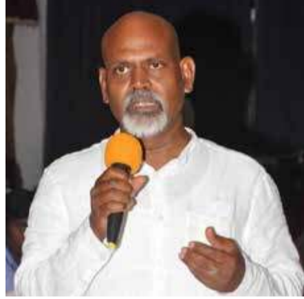
கர்த்தாவாக அவர் இருந்தார். இந்த ஊழல், மோசடியால் அமைச்சரவை

வடக்கு மாகாண சபையில் பாரிய ஊழல், மோசடிகள் இடம்பெறக் காரண