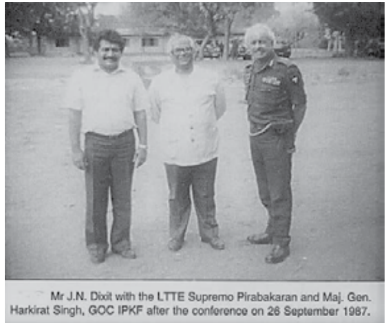
Mr. J.N. Dixit with the LTTE Supremo Pirabakaran and Maj. Gen. Harkirat Singh, GOC IPKF after the conference on 26 September 1987.

சாராம்சத்தில் ஜெயவர்த்தனா ஒரு கடும்போக்கான சிங்களத் தேசியவாதியாவார். ஆழமான சிங்கள மேலாண்மைவாதப் போக்குடையவர். பெரும்பான்மைச் சிங்களவரின் நலன்களைப் பேணுவதில் மிகவும் நாட்டம் கொண்டவர். தனது நீண்ட அரசியல் வரலாற்றில் தமிழ் மக்களுக்கு நீதி வழங்க மறுத்து, அவர்களது அரசியல் சுதந்திரங்களைப் பறித்து, அவர்களது உரிமைப் போராட்டங்களை நசுக்கி, சிங்கள