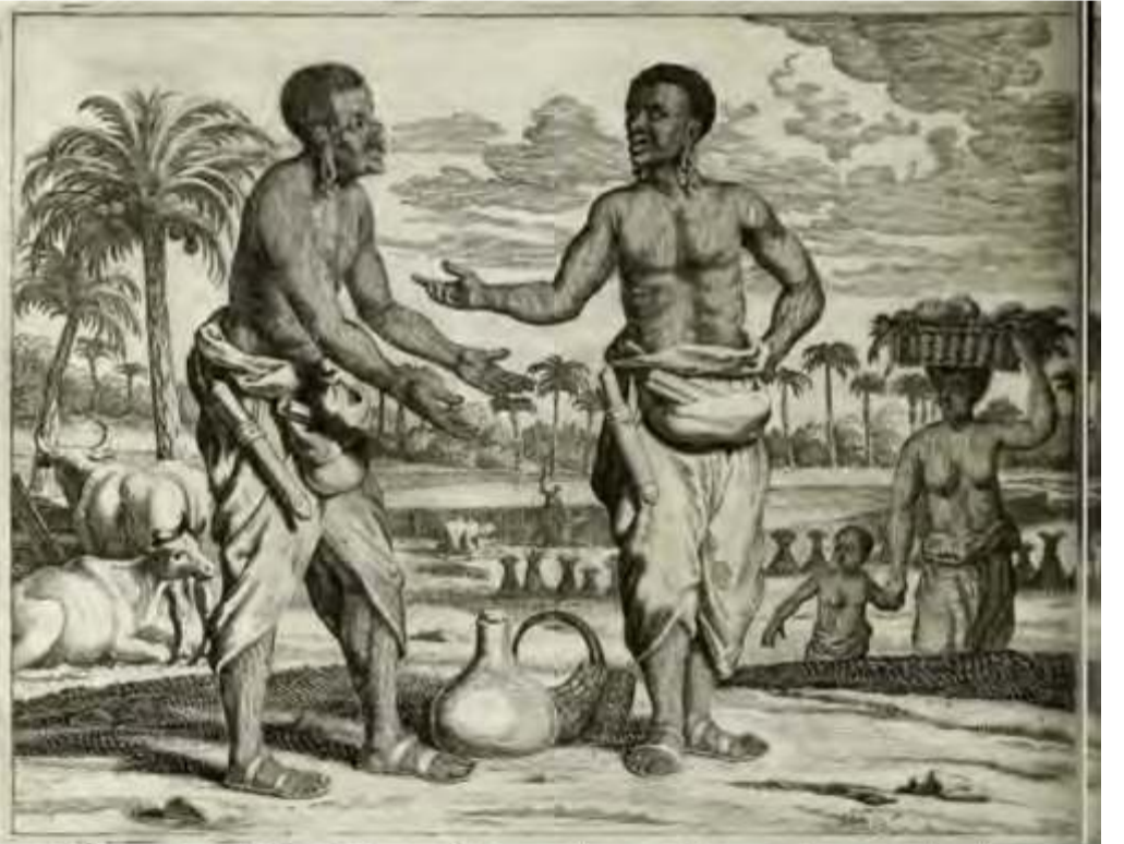
பல்தேயஸ் பாத்திரியாரின் நூலில் உள்ள யாழ்ப்பாணத்து ஆண்கள் இருவர் உரையாடுவதைக் காட்டும் படம்

யாழ்ப்பாணக் கோட்டை மீதான முற்றுகை, ஊர்காவற்றுறைக் கடற்கோட்டை கைப்பற்றப்பட்டமை, யாழ்ப்பாணக் கோட்டையில் இருந்த போர்த்துகேயப் படைகள் சரணடைந்தமை, ஒல்லாந்தருக்கு எதிரான சதி, சதியில் ஈடுபட்டோருக்கான தண்டனைகள் போன்றவை நூலில் விபரமாகத் தரப்பட்டுள்ளன. மேற்படி விடயங்கள் பற்றி இத்தொடரின் முந்திய கட்டுரைகளில் கூடுதலான தகவல்களைப் பார்த்தோம். இவை தவிர, ஒல்லாந்தர் காலத்தின் முதற் பத்தாண்டில் மதம் தொடர்பான பல்வேறு நடவடிக்கைகள், ஒல்லாந்தரின் மதத்தைப் பரப்புவதற்கு