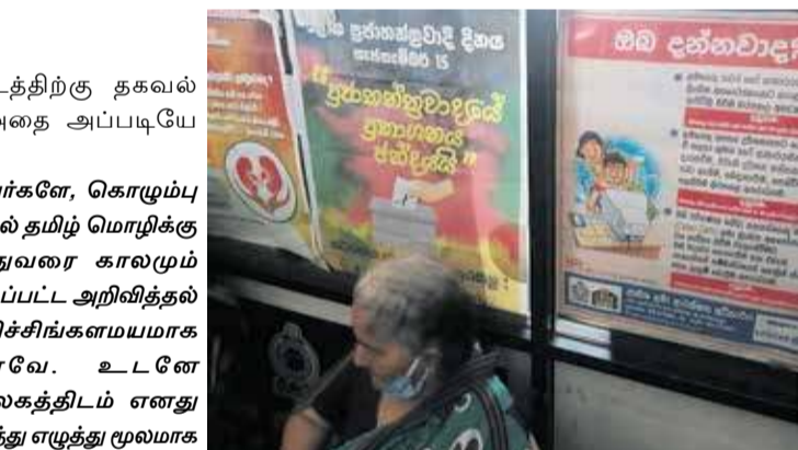
இடம்பெறும் வகையில் நடவடிக்கை எடுக்க வேண்டும். இல்லையெல்லை நானாகவே தமிழ் எழுத்து எழுத வேண்டி வரும். உரியவர்களிடம் சொல்வது உங்கள் கடமை"

"ஐயா, ஆசிரியர் அவர்களே, கொழும்பு 12., பிரதேச செயலகத்தில் தமிழ் மொழிக்கு என்ன நடந்தது? இதுவரை காலமும் மும்மொழிகளிலும் எழுதப்பட்ட அறிவித்தல் யாவும் இப்போது தனிச்சிங்களமயமாக காட்சியளிக்கின்றனவே. உடனே இன்று பிரதேச செயலகத்திடம் எனது ஆட்சேபணையை தெரிவித்து எழுத்து மூலமாக எனது முறைப்பாட்டை கொடுத்துள்ளேன். கொழும்பில் இயங்கும் இரண்டு பிரதேச செயலகத்தில் (கொழும்பு மத்திய பிரதேச செயலகம் - டாம் வீதி, கொழும்பு கிழக்கு - மேற்கு பிரதேச செயலகம் - திம்பிரிகல்யாய) தமிழ் மொழியில் கருமமாற்றமுடியும். ஏன் இந்த பாரபட்சமான நடவடிக்கை எடுக்கப்பட்டது என்பது புதிதாக உள்ளது. உடன் மாற்றம் செய்து தமிழ்மொழியும்