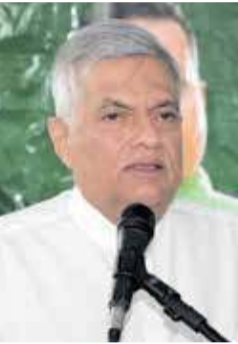
கட்சியிலிருந்து விலகி பொதுத் தேர்தலில் போட்டியிட்டு எவரும் ஐக்கிய தேசிய கட்சியின் உறுப்பினர்கள் இல்லை என்று தெரிவித்துள்ள அந்தக் கட்சியின் தலைவரும் முன்னாள் பிரதமரும் மாணரணில் விசுவநாதன், நாட்டைக் கட்டியெழுப்புவதற்கு மாணாக்கங்களுக்கிடையிலான அதிகாரப்பிரிவு அவசியமென்றும் குறிப்பிட்டுள்ளார்.

கொழும்பு கொரிண்டன் மாவட்டத்தில் கடந்த புதன்கிழமை இடம்பெற்ற மக்கள் சந்திப்பில் இவ்வாறு தெரிவித்த அவர் மேலும் தெரிவிக்கையில், குருநாகல் புவனேசுவரம் மன்னனின் ராஜசபை உடைக்கப்பட்டுள்ளது. சிங்களத்துவம் தொடர்பில் பேசுவார்களுக்கு நாட்டின் வரலாறும் பாரம்பரியமும் தெரியவில்லை. ஒருபுறம் பூர்வீகப் பொதுஜன பெரமுன சிறுபான்மை மக்களை ஓரங்கட்டி வருகிறது.