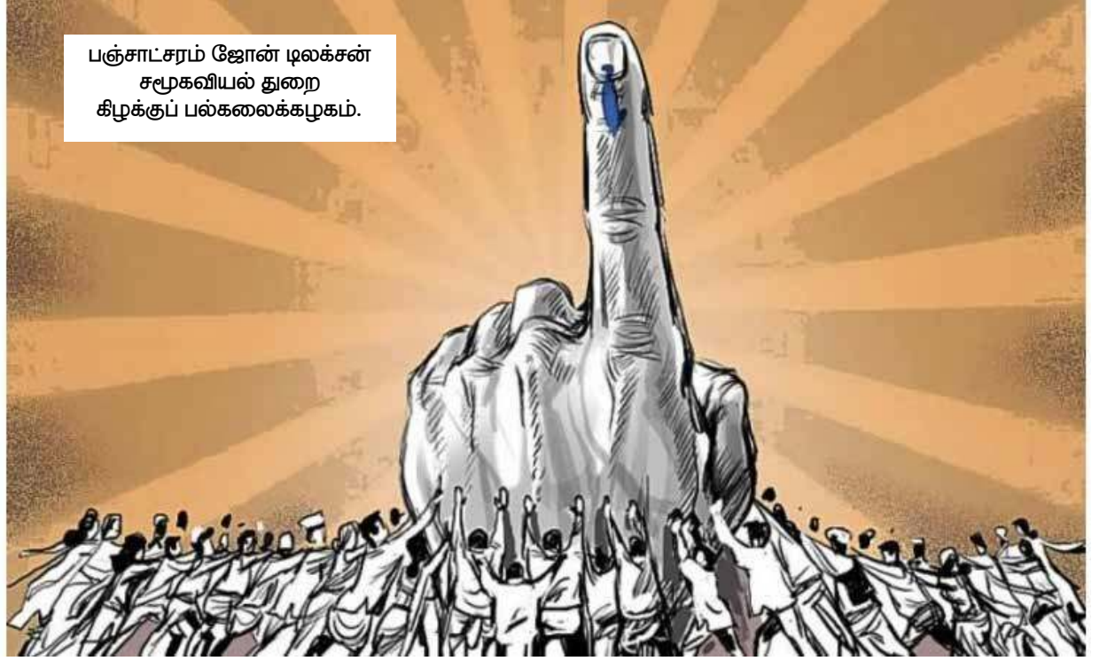
பஞ்சாட்சரம் ஜோன் டிலக்சன் சமூகவியல் துறை கீழ்க்குப் பல்கலைக்கழகம்.

ஒவ்வொரு நாட்டு குடிமக்களுக்கும் இருக்கின்ற மிகப்பெரிய கடமை வாக்களிப்பதாகும். இந்த ஜனநாயக உரிமையினை முழுமையாக நிறைவேற்ற வேண்டும் என்பதற்காக ஒவ்வொரு குடிமகனும் வாக்களிக்க வேண்டும். அதுமட்டுமில்லாது வாக்காளன் அளிக்கும் வாக்கே அவனுடைய எதிர்காலத்தை தீர்மானிப்பதாய் அமைவதால் கட்டாயம் தனது வாக்கு உரிமையை அவன் பயன்படுத்த வேண்டும். வாக்களிக்கும் சந்தர்ப்பத்தில்தான் வாக்காளர்கள் மிக அவதானத்துடனும், தெளிவுடனும் நடந்து கொள்வது அவசியமாகும். வாக்காளனின் வாக்கே வாக்காளரைக் காப்பாற்றும் என்பதை சிந்தனையில் கொள்ள வேண்டும். வேட்பாளர்களின் வாக்குறுதிகள் உங்களைக் காக்காது. குறிப்பிட்ட வேட்பாளரைத் தெரிவு செய்து அதிகாரத்தை கையளிப்பதற்கு முன்னர் அவரின் உண்மைத் தன்மை பற்றியும், அவருடைய தகுதி நிலை பற்றியும் ஆழமாக சிந்தித்து வாக்களிக்க வேண்டும். ஜனநாயகம் என்பது வாக்காளர்களின் சுதந்திரத்திலும், சுதந்திரம் என்பது ஜனநாயகத்தைப் பாதுகாப்பதிலும் தங்கியுள்ளன. அரசியல் வாதிகள் காலத்திற்குக் காலம், கட்சி மாறலாம், கொள்கையை மாற்றலாம், தடம் மாறலாம். ஆனால் வாக்காளர்கள் எப்போதும், எவ்வேளையும் தடம்