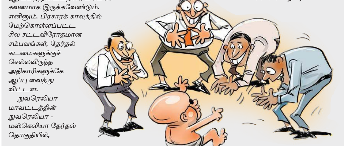
நுவரெலியா மாவட்டத்தின் நுவரெலியா - மஸ்கெலியா தேர்தல் தொகுதியில்,

செய்துவிட்டது. இதற்கிடையில், ஓகஸ்ட் 5ஆம் திகதி வாக்களிப்பு நிலையங்களில், சிரேஷ்ட தலைமைத்துவ பங்கேற்கவிருப்போரை பங்களாவுக்கு அழைத்து, விருந்தொன்றையும் வழங்கிவிட்டதாகத் தகவல். இது உயரிடத்தின் காதுகளுக்குச் சென்றதைப்போல, சிரேஷ்ட தலைமைத்துவ அலுவலர்களாகக் (எஸ்.பி.ஓ) கடமையாற்றவிருந்த அதிகாரிகளுக்கு, நுவரெலியா மாவட்டச் செயலாளர் அனுமதியளிக்கவில்லை எனவும் விசாரணைகளை முன்னெடுத்துள்ளார் என்றும் பார்த்துள்ளனர். 'குழந்தை'யுடன் சேர்ந்து கும்மியடித்ததால், அதிகாரிகளுக்கும் ஆப்பாகிவிட்டதென, சிவனொளிபாதமலையைத் தரிசிக்கச் செல்லும் வழிநடுவே பேசுகொள்கின்றனர்.