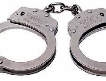
கடமைகளில் ஈடுபட்டனர் எனக் குற்றஞ்சாட்டப்பட்ட பொலிஸ் அதிகாரிகள் 10 பேருக்கு எதிராக

ஒழுக்காற்று நடவடிக்கைகள் முன்னெடுக்கப்பட்டுள்ளன என்றும் தெரிவித்த அவர், தேர்தல் சட்டதிட்டங்களை மீறிய குற்றச்சாட்டின் கீழ், 320 முறைப்பாடுகள் கிடைத்துள்ளன. 360 பேர் கைது செய்யப்பட்டுள்ளனர். அத்துடன், தேர்தல் குற்றங்கள் தொடர்பில், 86 முறைப்பாடுகள் கிடைத்துள்ளன.