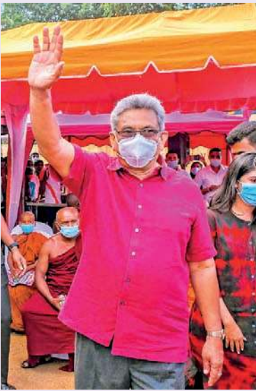
தெரிவித்துள்ளார். ஸ்ரீ லங்கா பொதுஜன பெரமுனவின் சார்பில் போட்டியிடுகின்ற வேட்பாளர்களை ஆதரித்து, ஹும்பாந்தோட்டையில்

நான்கு பாரிய வர்த்தக நகரத் திட்டத்தில் கொழும்பு, யாழ்ப்பாணம், திருகோணமலை ஆகிய மாவட்டங்கள் ஏனைய மாவட்டங்களாக உள்ளடக்கப்பட்டுள்ளதோடு, நான்கு பாரிய நகரங்களில் துறைமுகம், விமான நிலையத்தை மய்யப்படுத்திய சி வடிவம் கொண்ட பொருளாதாரக் கொரிடோவை நிர்மாணித்து, சர்வதேச வியாபாரத்துடன் போட்டியிடும் நாடாக இலங்கையைக் கட்டியெழுப்புவதாகவும் அவர்