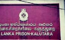
மூவரும் மக்கொன, கல்பாத கருத்துறை தெற்கு பகுதிகளைச் சேர்ந்தவர்களாவர் எனவும் தெரிவிக்கப்படுகிறது. மேலும், இரு கைதிகளைத் தேடி சுற்றிவளைப்புடன் முன்னெடுக்கப்பட்டுள்ளதாக பொலிஸார் தெரிவித்துள்ளனர்.

கருத்துறை சிறைச்சாலையில் கைதிகள் மூவர், நேற்று (02) அதிகாலை தப்பியோடியிருந்த நிலையில், அவர்களில் ஒருவரை நேற்று மதியே கைது செய்துள்ளதாகப் பொலிஸார் தெரிவித்தனர். சிறைச்சாலையில் தனிமைப்படுத்தப்பட்டிருந்த கைதிகளே இவ்வாறு தப்பிச் சென்றுள்ளனர் எனவும் தப்பிச்சென்ற கைதிகள்