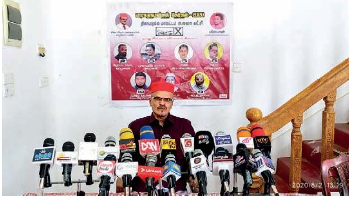
"நடைபெறவுள்ள தேர்தலில், முஸ்லிம் மக்கள்; குறிப்பாக கிழக்கு மாகாண முஸ்லிம் மக்கள், சிறந்த தலைவரைத் தெரிவுசெய்ய முன்வர வேண்டும்" என்றார்.

முஸ்லிம் உலமாக்கட்சியின் தலைவரது அலுவலகத்தில், நேற்று (02) நடைபெற்ற ஊடகவியலாளர் சந்திப்பின் போதே, அவர் இவ்வாறு வேண்டுகோள் விடுத்தார். அங்கு அவர் தொடர்ந்துரைக்கையில்,