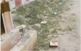
(பிரபாகரன் டிலக்சன்) யாழ்ப்பாணம், ஓக. 05 யாழ்ப்பாணத்தில் வாக்குச்

சாவடிகளை அண்மித்த வீதிகளில் வேட்பாளர்களின் துண்டுப்பிரசுரங்கள் பரவலாக விசிறப்பட்டுள்ளன.