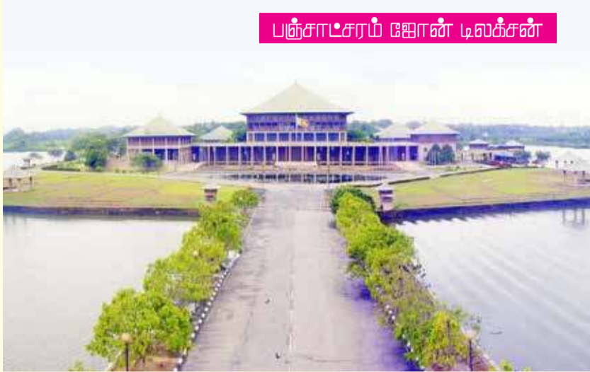
பஞ்சாட்சரம் ஊரான் டிஸ்க்சன்

இந்த 360,000 வாக்குகள் 6 இனாலும் பிரிக்கப்பட்டால் 60,000 வாக்கு வரும். ஒரு ஆசனத்திற்குத் 60,000 வாக்குகள் தேவை. இதன்படி முதல் சுற்றில் கட்சி A இற்கு 140,000 வாக்குகள் இருப்பதால் 2 ஆசனங்கள் வழங்கப்பட்டு, இரண்டாம் சுற்று ஆசனப்பகிர்விற்காக மீதமுள்ள 20,000 வாக்குகள் அக்கட்சியிடம் இருக்கும். இதேபோன்று கட்சி B 110,000 வாக்குகளைப் பெற்றிருப்பதால் ஒரு ஆசனம் வழங்கப்பட்டு, இரண்டாம் சுற்று ஆசனப்பகிர்விற்காக மீதமுள்ள 50,000 வாக்குகள் அக்கட்சியிடம் இருக்கும். ஏனைய கட்சி C, கட்சி D, கட்சி E ஆகியவை 60,000 வாக்குகளைப் பெறாத