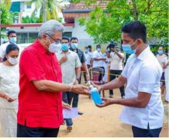
ஐனாதிபதி கோட்டாபய ராஜபக்ஷ