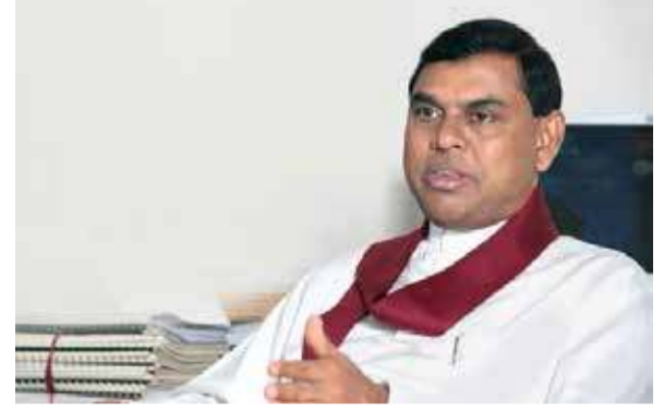
மெதமுலன் டி.ஏ.ராஜபக்ஷ மகா வித்தியாலத்தில் நேற்று வாக்களித்த பின்னர் ஊடகங்களுக்குக் கருத்து வெளியிடும் போது இந்தத் தகவல்களை பஸில் வெளியிட்டார்.

சுகாதார பாதுகாப்பு விதிமுறைகளை அனுசரித்துத் தேர்தலை மிகவும் சிறப்பாக நடத்தியமை தொடர்பில் சம்பந்தப்பட்ட சகல தரப்புகளுக்கும் மக்களுக்கும் ஸ்ரீலங்கா பொதுஜன பெரமுன சார்பில் பஸில் ராஜபக்ஷ நன்றி தெரிவித்தார்.