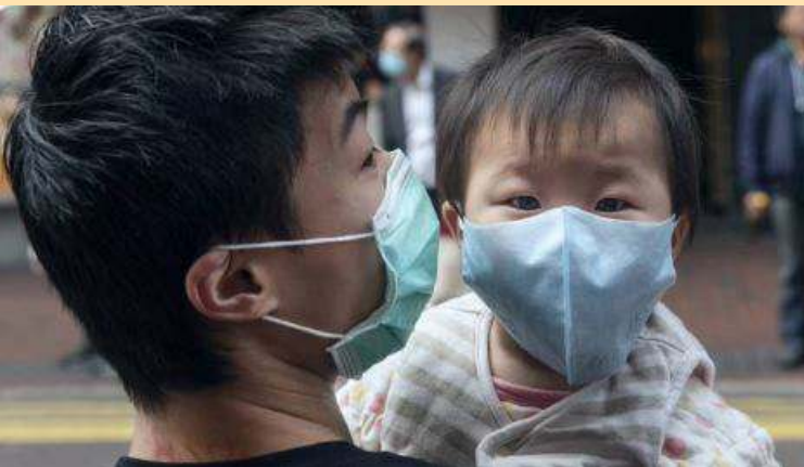
மடைந்து வீடு திரும்பினார் நஞ்சிங். அதன்பிறகு, இவரைப்போன்றே ரத்த வெள்ளை

டிக் போர்னே வைரஸ் குறித்து மருத்துவ நிபுணர்கள் கூறுகையில், இந்த வைரஸ் கொரோனாவைப் போல சவாலாக மாறுமா என்பதைப் பொறுத்திருந்துதான் பார்க்க வேண்டும். இந்த வைரஸ் உண்ணி, ஈக்களிடமிருந்து மனிதர்களுக்குப் பரவியுள்ளது. மேலும் ரத்தம், சளி, இருமல் மூலமும் மனிதர்களிடமிருந்து மனிதர்களுக்கு எளிதில் பரவுகிறது என்று எச்சரித்துள்ளனர்!