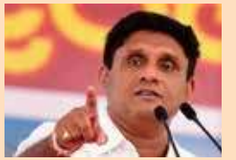
01) சஜித் பிரேமதாஸ - 3,05,744