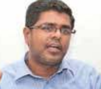
03) முஜிபுர் ரஹ்மான் - 87,589