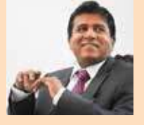
04) விஜேதாஸ ராஜபக்ஷ - 1,20,626