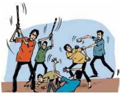
வாழைச்சேனை பொலிஸார் மேற்கொண்டு வருகின்றனர்.

நடத்தப்பட்ட இந்தச் சம்பவத்தில் காயமடைந்த நால்வரும், வாழைச்சேனை ஆதார வைத்தியசாலையில் அனுமதிக்கப்பட்டு, பின்னர் அவர்களில் இருவர் மேலதிக சிகிச்சைக்காக மட்டக்களப்பு போதனா வைத்தியசாலைக்கு இடமாற்றப்பட்டுள்ளனர். இது தொடர்பான விசாரணைகளை