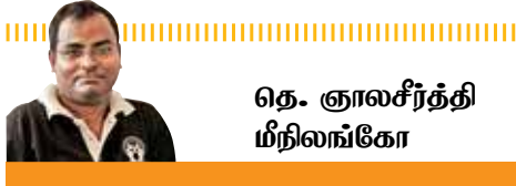
தெ. ஞானசீரந்தி ய்நிலங்கோ

தேர்தல் திருவிழா முடிந்தது. தேர்தல் வாக்குறுதிகளும் இத்தோடு முடிந்துபோய். இனிக் கொஞ்சம் நிதானமாகச் சிந்திப்போம். கொவிட்-19 தொற்றுக் காலத்தில், இலங்கை பாரிய நெருக்கடிகளை எதிர்நோக்கியிருக்கிறது. கடந்த ஒருமாத கால தேர்தல் பிரசாரங்கள், நெருக்கடிகளை உருமாற்றிப் செய்து, மக்களின் கவனத்தைக் கச்சிதமாகத் திசைநடுப்பி இருக்கின்றன. ஆனால், அவை ஒவ்வொன்றாக, இலங்கையர்களைப் பாதிக்கும். அந்தப் பாதிப்புகளை எதிர்கொள்வதற்கு, நாம் தயாராக இருக்கிறோமா?