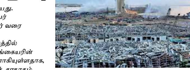
அதிகாரிகள் யாரும் காயமடையவில்லை என, தூதரகத் தகவல்கள் தெரிவிக்கின்றன. லெபனானில் சுமார் 25,000க்கு மேற்பட்ட இலங்கையர்கள் வாழ்கின்றமை குறிப்பிடத்தக்கது.

வெடிப்பு சம்பவம் பதிவாகியது. இதில், குறைந்தது 135 பேர் உயிரிழந்துள்ளனர், 5,000 பேர் வரை காயமடைந்துள்ளனர். குறித்த வெடிப்புச் சம்பவத்தில் லெபனானில் வசிக்கும் இலங்கையரின் வீடுகளும் சேதத்துக்கு உள்ளாகியுள்ளதாக, அந்நாட்டிலுள்ள இலங்கைத் தூதரகம் தெரிவித்துள்ளது. அத்துடன், பெய்ரூட்டிலுள்ள இலங்கைத் தூதரகத்துக்கு சிறிது சேதம் ஏற்பட்டிருந்தபோதும் தூதரக