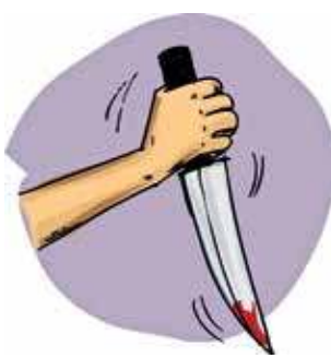
கேகாலை பொலிஸார், விசாரணைகளை முன்னெடுத்து வருகின்றனர்.

இடம்பெற்றுள்ளதாக பொலிஸார் தெரிவித்தனர். குறித்த தாக்குதலில், கேகாலை, வின்சன் விக்ரமசிங்க மாவத்தை பிரதேசத்தைச் சேர்ந்த 20 வயதுடைய இளைஞனே உயிரிழந்துள்ளார். சம்பவத்துடன் தொடர்புடைய சந்தேகநபர் தப்பிச் சென்றுள்ள நிலையில், சந்தேகநபரைக் கைது செய்வதற்காக