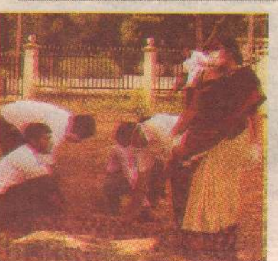
கிளிநொச்சி மாவட்டச் செயலகத்தில் செயலக அலுவலர்கள் நேற்று முன்தினம் துப்புரவுப் பணியில் ஈடுபட்டனர். (கு-222)