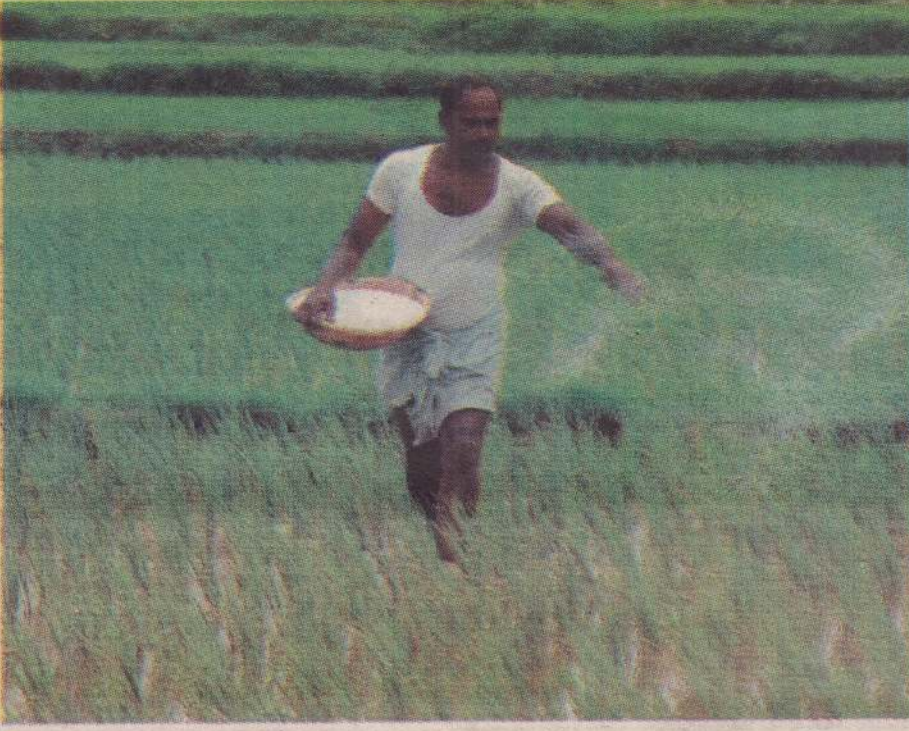
■ நோக்கரிய நோக்கன்