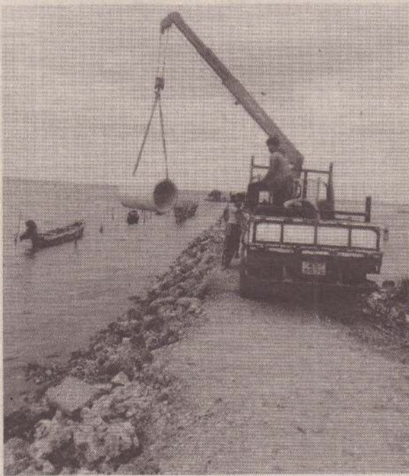
யாழ்ப்பாணம் நெடுங்குளம் கிராம அலுவலர் பிரிவினா உள்ள கொழும்புத்துறைத் துறைமுகம் அமைந்த பாதையில் மின்கம்பம் நடுகை செய்யும் அபிவிருத்தி வேலைகள் ஆரம்பிக்கப்பட்டுள்ளன. (க)

தற்போதைய கழநிலையில் புதிய தலைவர் நியமிக்கப்பட்டால் அது கட்சிக்குள்ளும், தேர்தலிலும் தாக்கத்தை ஏற்படுத்தக்கூடும் என்பதாலேயே, தேர்தலின் பின்னர் நியமிப்பதற்கு தீர்மானிக்கப்பட்டுள்ளது. தொண்டமான் குடும்பத்தில் இருந்தே ஒருவர் தலைமைப்பதவிக்கு வரவேண்டும் என டில்லியும், கொழும்பும் விரும்புவதால் அக்கட்சியில் உள்ள சிரேஷ்ட உறுப்பினர்களுக்கு வாய்ப்பளிக்கப்படாது என்றும், பெரும்பாலும் ஜீவன் தொண்டமான் அடுத்த தலைவராகத் தெரிவாகக்கூடும் எனவும் அறியமுடிகின்றது. இதற்கிடையில் தலைமைத்துவத்துக்காகப் போட்டி நிலவுவதாகவும் தெரியவருகின்றது. (ப)