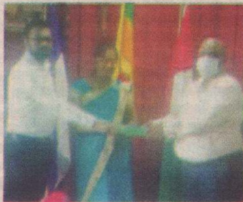
கொவிட் 19 பாதுகாப்பு நடவடிக்கைக்கு தேவையான உடல் வெப்பத்தை அளவிடும் கருவி ஒன்று உலக உணவுத்திட்டம் ஊடாக துணுக்காய் பிரதேச செயலகத்துக்கு வழங்கப்பட்டுள்ளது. (கு-222)

அண்மையில் நீண்ட காலம் இலங்கையில் இயங்கிவந்த நிதி நிறுவனமொன்று மூடப்பட்டதனைத் தொடர்ந்து அந்த நிறுவனத்தில் பணத்தை வைப்புச் செய்திருந்த வைப்பாளர்கள் பெரும் நெருக்கடிகளை எதிர்நோக்கி வருகின்றமை குறிப்பிடத்தக்கது. பெருந்தொகை பணத்தை நிதி நிறுவனங்களில் வைப்புச் செய்துள்ளவர்கள் இந்த விடயங்கள் குறித்து கவனம் செலுத்துவது பொருத்தமானது என்று தெரிவிக்கப்படுகிறது. (பு)