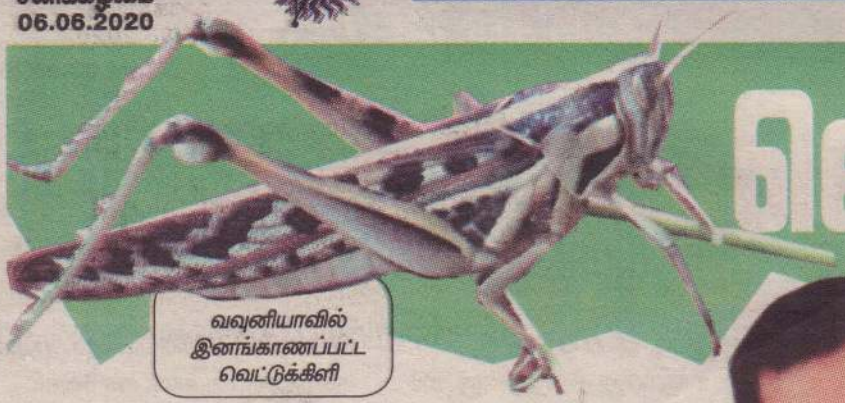
வவுனியாவில் இனங்காணப்பட்ட வெட்டுக்கிளி