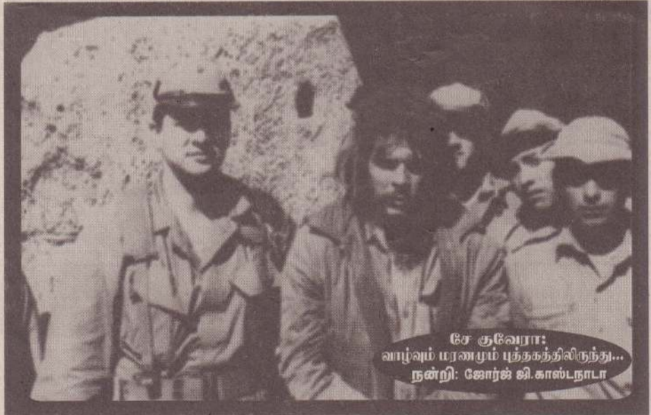
சே குவேரா: வாழ்வும் மரணமும் புத்தகத்திலிருந்து...