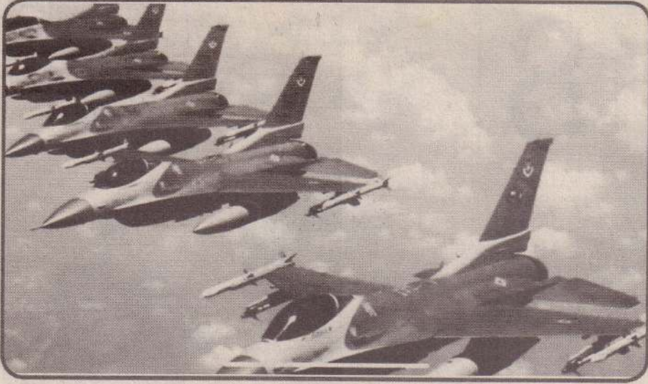
ஓகஸ்ட் 02 வாங்கியுள்ளது இந்தியா! 6 ராபேல் அதிநவீன ரக போர் விமானங்களை பிரான்ஸ் நாட்டிடமிருந்து ஆகாயத்திலிருந்து ஆகாயத்தில் 150

கிலோமீற்றர் தொலைவிலுள்ள இன்னுமொரு இலக்கை துல்லியமாகவும், தரைப் பகுதியிலுள்ள இலக்குகளை 300 கிலோமீற்றர் தொலைவிலிருந்து தாக்கவல்