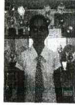
சி.வர்சிகா 2 ம் இடம்