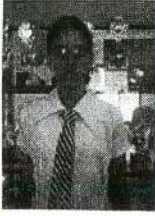
பா.கஜானா 1 ம் இடம்

2014 ஜப்பசிமாதம் சத்திய ஞானகோட்டத்தால் நடாத்தப்பட்ட பொதுஅறிவுப் பரீட்சையில் முதல் மூன்று இடங்களையும் பெற்ற