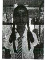
வி.பிரியதர்சினி 3 ம் இடம்