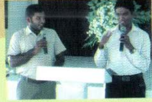
2012 - முதலாவது வாலிபர் ஒன்றுகூடல்