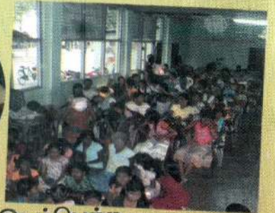
குடத்தையில் இடம்பெற்ற சுவிசேஷ சூட்டம்