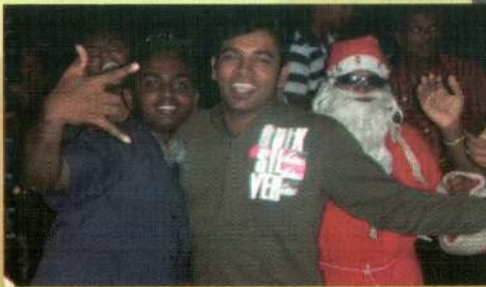
20.12.2011 - 24.12.2011 கரோல் நிகழ்வின் காட்சிகள்