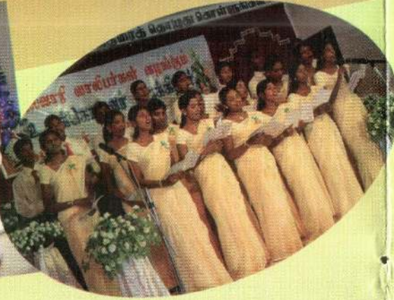
17.12.2011 அன்று நடைபெற்ற “உனக்கொருவர் சிருக்கிறார்” வாலிபர் நிகழ்வின் சில காட்சிகள்