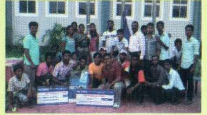
துடுப்பாட்ட சுற்றுப்போட்டியில் வெற்றி பெற்று சம்பியனாகிய போது