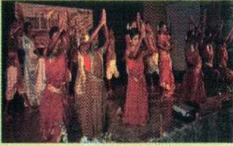
வாலிபர் பாசறையின் கலை நிகழ்வின் போது