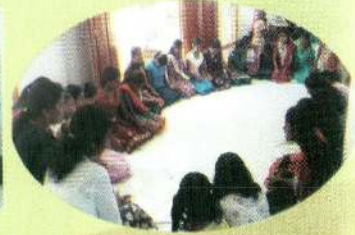
ஒருநாள் உபவாச ஜெபம்