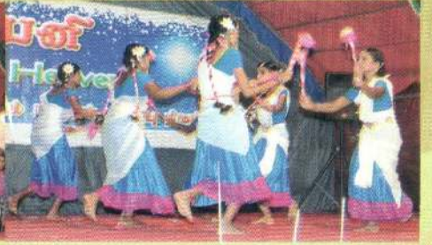
23-12-2012 யாழ்.தொழில்நுட்பக்கல்லூரி மைதானத்தில் கழுக்குகள் நடாத்திய "விண்பனி" கிறிஸ்மஸ் சிறப்பு நிகழ்ச்சியின் போது