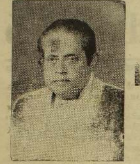
அகப்பட்டாய்' என்று அவரிடம் கூறினேன்.

ஒன்றும் செய்யமுடியாத விடத்துதான் அவருக்கு ஏமாற்றம் மற்றவர்கள் தன்னைத் தேடி வரவேண்டுமென்று அவர் என்றும் இயமாந்து இருந்ததில்லை. கண்டிக்கு வரும்போதெல்லாம் தெரிந்தவர் இல்லங்களைத் தேடி அலைவார். பெரியோர், சிறியோர் என்ற பேதம் அந்தப் பார்வையில் இல்லை. கடைசியாக வந்தபோதும் ஒருநாள் முழுமையும் அப்படித்தான் அலைந்தார். செட்டம்பர் முதலாம் திகதி கொழும்பு திரும்புவதற்கு வழக்கம்போல் அடிசுர அவசரமாகப் பேராதனைச் சந்தி புக்க வண்டி நிலையத்திற்குச் சென்றிருந்தபோது, சங்கான் புக்க பதற்குப் புக்கமிலைத் தூண்டி தேடினார். காணவில்லை. ஒவ்வொரு ஆசிரியர் ஒருவரின் விட்டில் விட்டுவிட்டு வந்ததை அவர் நினைவுக்கு வந்தது. சிந்தித்துவிட்டு, "அடுத்த முறை வருகிறபோது எடுக்கலாம்" என்றார்.