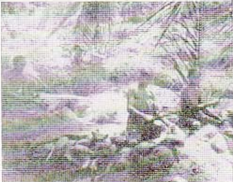
மிகவும் பரவலான குடிசைக் கைத்தொழில்களில் ஒன்றான கயிறு திரித்தல். இக் கைத்தொழிலின் விருத்திக்காகவும் வங்கிக் கடன்கள் வழங்கப் பட்டு வருகின்றன.