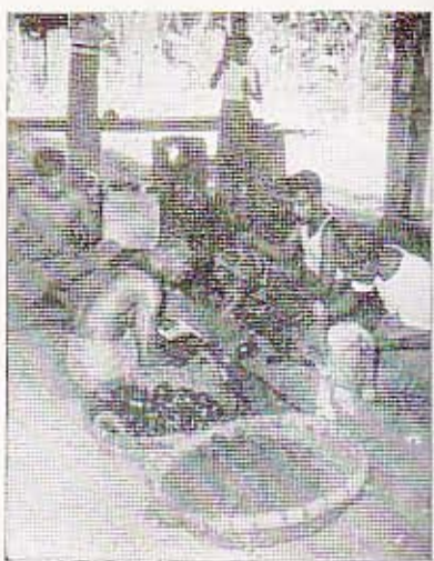
கிராமியக் கலைஞருக்கும், கைவினைஞருக்கும் நிறுவன ரீதியான கடன்கள் முதன் முதல் மக்கள் வங்கியால் பெற்றுக் கொடுக்கப்பட்டன.