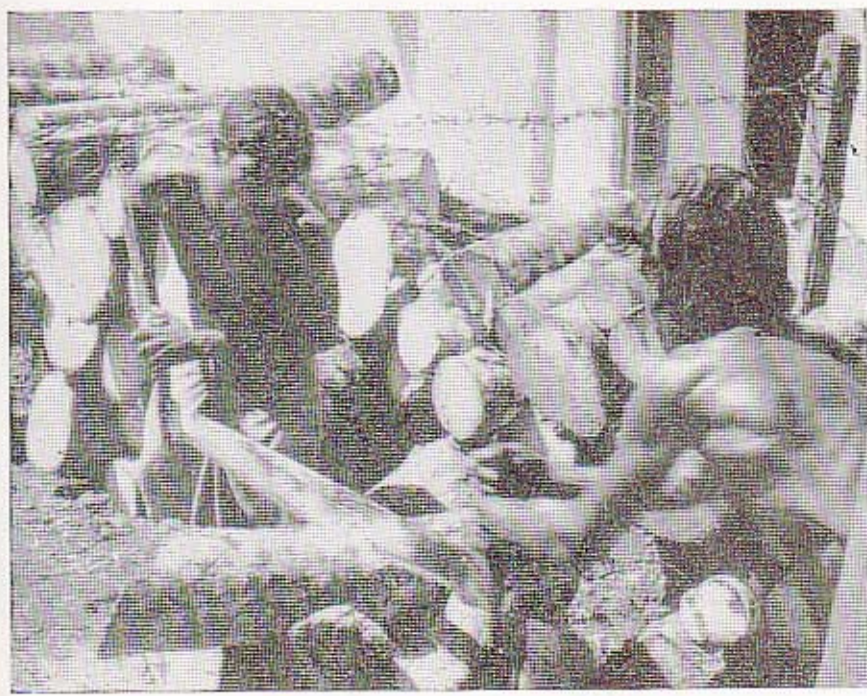
எரி பொருளாக்காக விற்கு வழங்கும் விறகு-மடுவம் இது. இத்துறையும் இப்பொழுது வங்கிக் கடனுதவிகளைப் பெற்றுக்கொள்கின்றது.