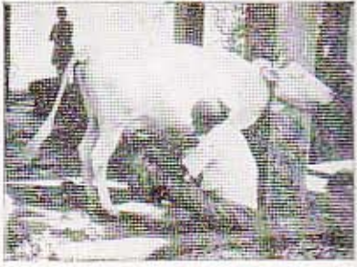
கிராமங்களில் பாற் பண்ணைக் கைத் தொழிலுக்கு இப்பொழுது உற்சாகம் கொடுக்கப்படுகின்றது. இத்துறைக் கான வங்கிக் கடன்களில் பெரும் பகுதியை மக்கள் வங்கி வழங்குகின்றது.