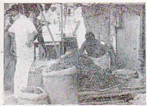
கிராமச் சந்தை — நிறுவன ரீதியற்ற கடன் அமைப்பே இங்கு தொடர்ந்து ஆதிக்கம் பெற்று வந்துள்ளது. "கைமாற்று"க் கடன் திட்டங்கள் மூலம் மக்கள் வங்கி இங்கு ஊடுருவி உள்ளது.