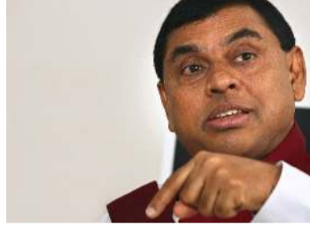
திருத்திக்கொண்டு முன்னோக்கிப் பயணிப்போம். நாட்டை கட்டியழுப்புவதே எமது பிரதான நோக்கம். இதில் அனைவரும் இலங்கையராக இணையவேண்டும்-என்றார்.

அதனை இயற்றுவதற்கு முன்னர் நிச்சயம் 19 ஐ நீக்குவோம். அதன்பின்னர் மக்களின் ஒத்துழைப்புடன் நாட்டுக்கு தேவையான அரசமைப்பு உருவாக்கப்படும். எமது அரசு மீது மக்கள் வைத்துள்ள நம்பிக்கை வீணடிக்கப்படமாட்டாது. வழங்கப்பட்ட வாக்குறுதிகள் நிறைவேற்றப்படும். கடந்தகாலத் தவறுகளைத்