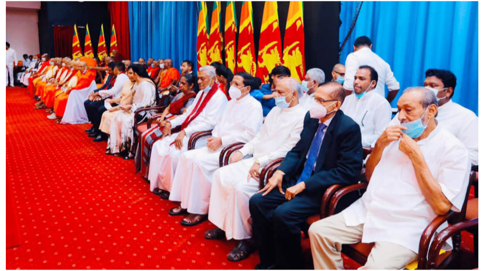
பிரதமர் மஹிந்த ராஜபக்ஷ நேற்று தமது கடமைகளை அதிகாரபூர்வமாகப் பொறுப்பேற்றுக் கொண்டார். அலரி மாளிகையில் இந்த நிகழ்வு நடந்தது.