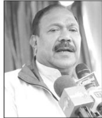
ங்களுக்கு கருத்து தெரிவிக்கும் போதே அவர் இதனைக் குறிப்பிட்டுள்ளார்.

அமைச்சு பதவிகள் வழங்கப்பட்டமை தொடர்பாக ஊடக