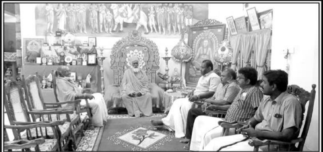
நாடாளுமன்றத் தேர்தல் முடிவடைந்த பின்னர் தமிழ்த் தேசிய மக்கள் முன்னணி சார்பில் பாராளுமன்றத்திற்குச் செல்லும் உறுப்பினர்கள் உள்ளடங்கிய கட்சியின் உறுப்பினர்கள் சைவ சமயத் தலைவர்களைச் சந்தித்து ஆசி பெற்றனர். நேற்று முன்தினம் இரவு நல்லை ஆதீனத்தில் மேற்படி சந்திப்பு இடம்பெற்றது.