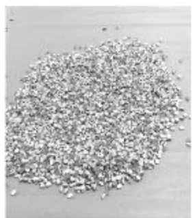
(கொழும்பு) சுமார் இரண்டு கோடி

48 லட்சம் ரூபாய் மதிப்புள்ள 4 ஆயிரத்து 960 போதை மாத்திரைகள் கட்டுநாயக்க விமான நிலையத்தின் சுங்கப் பிரிவினரால் நேற்று முன்தினம் கைப்பற்றப்பட்டுள்ளன.