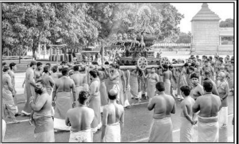
நல்லூர் கந்தசுவாமி ஆலய வருடாந்த மஹோற்சவத்தின் 19 ஆம் திருவிழாவான சூர்யோற்சவம் நேற்றுக் காலை நடைபெற்றது. காலை 6.45 மணியளவில் இடம்பெற்ற வசந்தமண்டப பூஜையை அடுத்து ஏழு குதிரைகள் பூட்டிய ரதத்தில் எழுந்தருளிய சூரியபகவான் உள் வீதி, வெளி வீதியுலா வந்தார்.