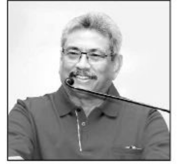
வழங்கி வைத்தார். அமைச்சரவை பதவியேற்கும் நிகழ்வு காலை 11 மணியளவில் நிறைவு பெற்றது. (ஜ-4)

மூன்றாவதாக 26 அமைச்சு பதவிகள் வழங்கப்பட்டன. பாதுகாப்பு அமைச்சு பதவி ஜனாதிபதி கோட்டாபய ராஜபக்ஷவிற்கு வழங்கப்பட்டது. நிதி மற்றும் புத்தாசனம், மத விவகாரங்கள், கலாசார அலுவல்கள் அமைச்சு பிரதமர் மகிந்த ராஜபக்ஷவிற்கு வழங்கப்பட்டது. 26 அமைச்சுகளுக்கான நியமனப் பத்திரங்களை ஜனாதிபதி கோட்டாபய ராஜபக்ஷ