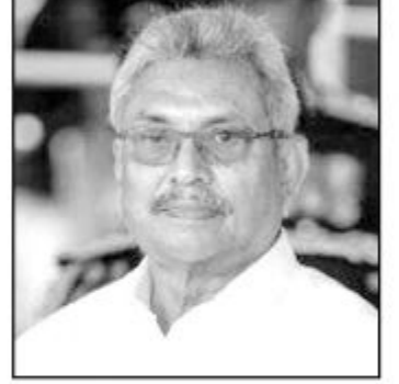
டாபய ராஜபக்ஷ பதவி வகிப்பார் என்று அறிவிக்கப்பட்டுள்ளது. (ஐ-4)

இந்த அறிவிப்பு வெளியிடப்பட்டது. 19 ஆவது திருத்தத்துக்கு அமைய ஜனாதிபதி அமைச்சுப் பதவி வகிக்க முடியாது என்பதற்கு அமைய கோட்டாபய ராஜபக்ஷ தலைமையிலான இடைக்கால அரசியல் பாதுகாப்பு அமைச்சு எவருக்கும் வழங்கப்படவில்லை. இந்நிலையில் அறுதிப்பெறும்பான்மையோடு ஆட்சி அமைக்கும் புதிய அரசியல் பாதுகாப்பு அமைச்சராக ஜனாதிபதி கோட்