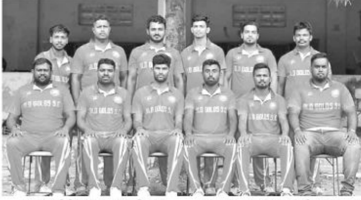
யாழ். கிரிக்கெட் சம்பியன் 2020 தொடரின் முதலாவது சுற்றில் ஒல்ட்கோல்ஸ் அணி ஜொலிஸ்ரா அணியை 214

ஒட்டங்களால் வெற்றிபெற்று 2 ஆவது சுற்றுக்குத் தகுதி பெற்றுள்ளது. முதலில் துடுப்பெடுத்தாடிய