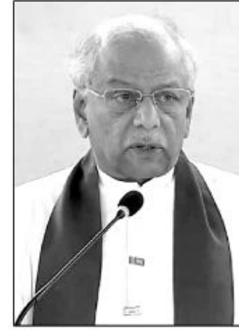
களின் பிரதிநிதிகள் என அவர்களால் கூறிக் கொண்டிருக்க

அவர்களின் வாக்கு வீதத்திலும் சரிவு ஏற்பட்டுள்ளது. இவ்வாறான நிலைமையில் நாங்கள் மட்டுமே தமிழ் மக்