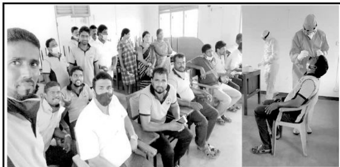
கரவெட்டி சுகாதார வைத்தியர் பணிமனையினூடாக பொதுமக்களுடன் நேரடி தொடர்பிலுள்ள அரச அலுவலர்களுக்கான PCR பரிசோதனை கரவெட்டி சுகாதார வைத்திய அதிகாரியால் கரவெட்டி பிரதேச செயலகத்தில் நேற்று மேற்கொள்ளப்பட்டது.

சந்தேகநபரை நீதிமன்றத்தில் முற்படுத்துவதற்கான நடவடிக்கைகள் மேற்கொள்ளப்படுவதோடு சம்பவம் தொடர்பான மேலதிக விசாரணைகளையும் வட்டுக்கோட்டைப் பொலிஸார் மேற்கொண்டு வருகின்றனர். (4-5-114)