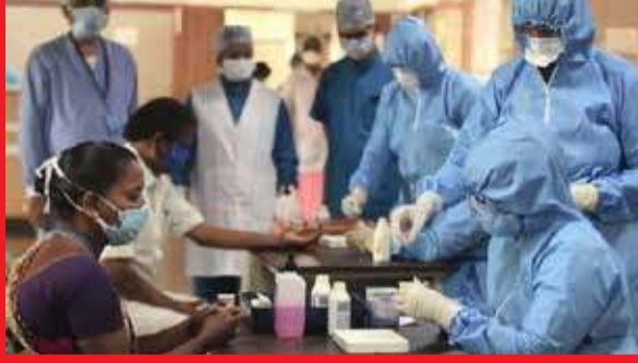
தும் சிகிச்சை பெற்று வருகின்றனர்.

அத்துடன் 16 இலட்சத்து 38 ஆயிரத்திற்கும் மேற்பட்டோர் குணமடைந்து வீடுதிரும்பியுள்ள நிலையில், 64 இலட்சத்து 4 ஆயிரத்திற்கும் மேற்பட்டோர் தொடர்ந்து