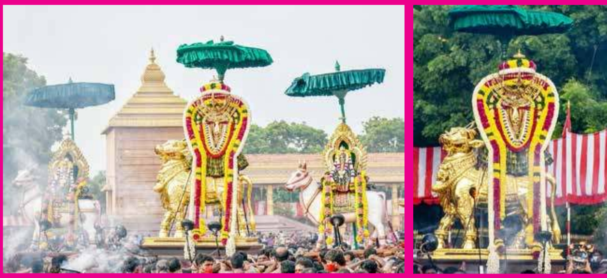
வரலாற்றுப் பிரசித்தி பெற்ற நல்லூர் கந்தசாமி ஆலய வருடாந்த மகோற்சவத்தின் 23 ஆம் நாளான நேற்று, மாலை உற்சவத்தின் போது தங்க இடபத்தில் முருகப் பெருமானும், வெள்ளை இடபங்களில் வள்ளி - தேவசேனாபதி தேவியரும் எழுந்தருளி அருள்பாலிக்கும் காட்சி