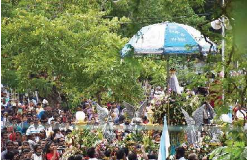
மன்னார் மருதமடு அன்னையின் ஆவணி திருவிழா இன்று சனிக்கிழமை காலை சிறப்பாக இடம்பெற்றபோது.....