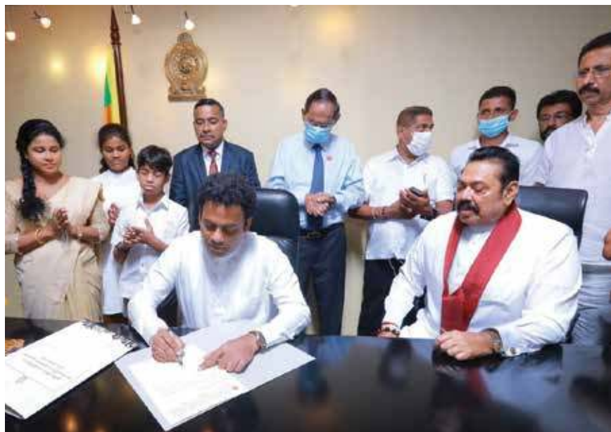
கிராமிய வீடமைப்பு மற்றும் நிர்மாணத்துறை மற்றும் கட்டடப்பொருள்கள் தொழில் மேம்பாட்டு அமைச்சர் இந்திக அருருத்த கடமைகளைப் பொறுப்பேற்றார்.

வாகன சாரதி அனுமதிப்பத்திரம், அடையாள அட்டைகள், முறைப்பாட்டுப் பத்திரங்களின் பிரதிகள், பிறப்புச் சான்றிதழ்கள் உள்ளிட்ட 19 போலி ஆவணங்களும் கைப்பற்றப்பட்டுள்ளன என பொலிஸார் குறிப்பிட்டனர். (ரி1)