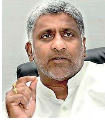
அத்தோடு, புதிய ஏற்றுமதிச் சந்தையின் தன்மையை அறிந்துகொண்டு, புதிய உற்பத்திப் பொருள்களைச் சந்தைக்கு அறிமுகப்படுத்த வேண்டுமெனவும், பிங்கிரிய முதலீட்டு வலயத்தின் அடித்தள வசதிகள், தற்போது

அத்தோடு, நாட்டுக்குள் வரும் முதலீடுகளுக்கான வாய்ப்புகளை வாய்ப்புக்களவே அரசாங்கம் எதிர்பார்க்கின்றதெனவும் எதிர்காலத்தில், 5 - 7 சதவீதம் வரையில், பொருளாதார வளர்ச்சியை ஏற்படுத்தவே முயற்சிப்பதாகவும் தெரிவித்தார்.