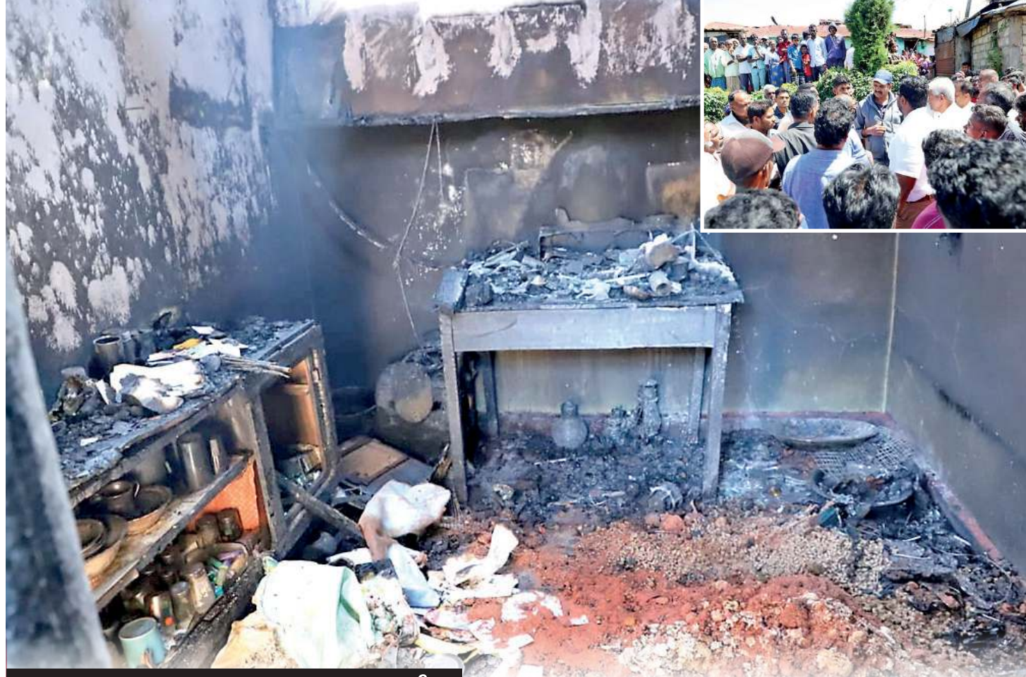
வோர்விக் தோட்டக் குழியருப்பில் தீ;