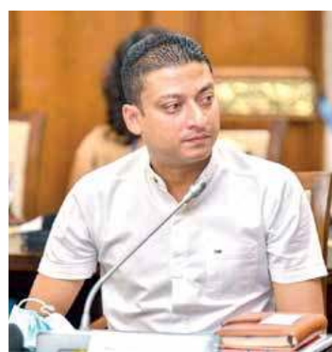
மிகவும் முக்கியமானதாகும் என்றும் ஜனாதிபதி குறிப்பிட்டார்.

மோட்டார் கார்களில் வந்து அதனை நிறுத்தி விட்டு பஸ்களில் பணி இடங்களுக்குச் செல்லும் முறைமையை (Park & drive) விரைவாக நடைமுறைப்படுத்தி வீதி நெரிசலை தீர்க்கவேண்டியதன் அவசியத்தை ஜனாதிபதி சுட்டிக்காட்டினார். போக்குவரத்து சபை பஸ் போக்குவரத்துச் சேவையை