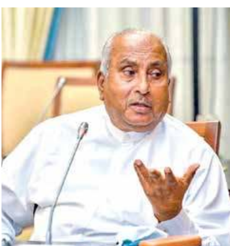
பொதுமக்களுக்கு சிறந்த சேவையை வழங்கக்கூடிய வகையில் புகையிரத