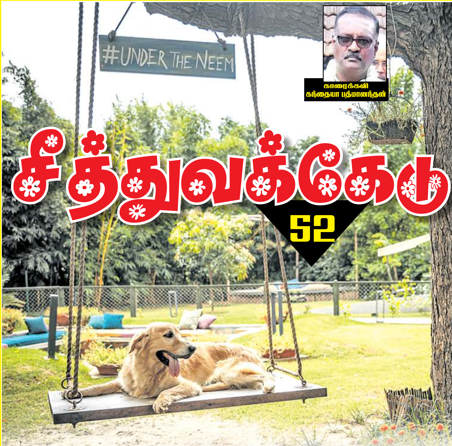
காரைக்கலி கந்தையா பதிமாணந்தன்