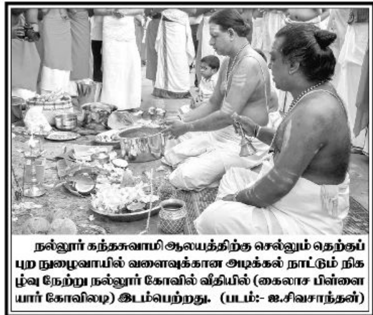
நல்லூர் கந்தசுவாமி ஆலயத்திற்கு செல்லும் தெற்குப் புற நுழைவாயில் வளைவுக்கான அடிக்கல் நாட்டும் நிகழ்வு நேற்று நல்லூர் கோவில் விதியில் (கைலாச பிள்ளையார் கோவில்) இடம்பெற்றது.