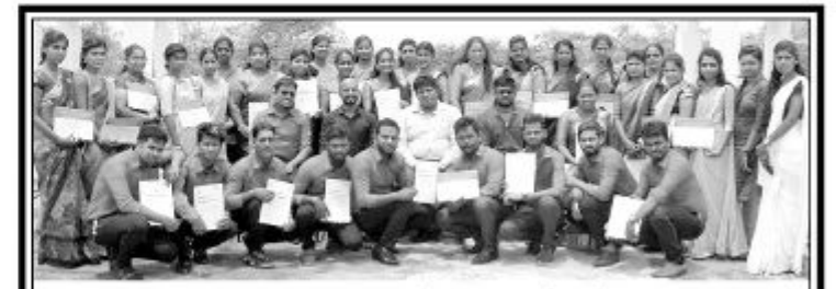
வடமாகாண இளையோர் வலுவூட்டல் வலையமைப்பின் பயிற்றுவிப்பாளர்களுக்கான பயிற்சி நெறிகளை நிறைவு செய்தவர்களுக்கான சான்றிதழ்கள் வழங்கும் நிகழ்வு யாழ்ப்பாணம் பொது நூலக மண்டபத்தில் அண்மையில் நடைபெற்றது.