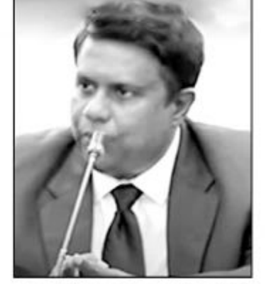
தமைக்காக ஒருவருக்கு 130 கிலோசும் ரூபா பணம் செலுத்தப்பட்டுள்ளது.

மாத்தறையில் இருந்து கொழும்புக்குப் போதைப் பொருளைக் கடத்திவர அரசு வாகனம் ஒன்றும் சில வாகனங்களும் பயன்படுத்தப்பட்டுள்ளன. ஹிக்கடுவைப் பகுதியில் போக்குவரத்து வசதிகளை செய்