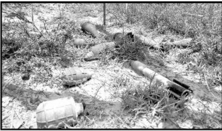
(முறிகண்டி) பிரதேசத்தில் தர்மக்கேணி கிளிநொச்சி பச்சிலைப்பள்ளி என்னும் கிராமத்தில் வயல்

விதைப்பு செய்வதற்காக காணி துப்புரவு பணியில் ஈடுபட்ட போது காணி உரிமையாளரால் சில வெடிபொருட்கள் அடையாளம் காணப்பட்டுள்ளன. சம்பவம் தொடர்பில் காணி உரிமையாளரால் பனை பொலிஸாருக்கு தகவல் வழங்கப்பட்டதையடுத்து சம்பவ இடத்திற்கு சென்ற பொலிஸார் வெடி பொருட்களை மீட்பதற்கான நடவடிக்கைகளை முன்னெடுத்து வருகின்றனர். (5-4-100)