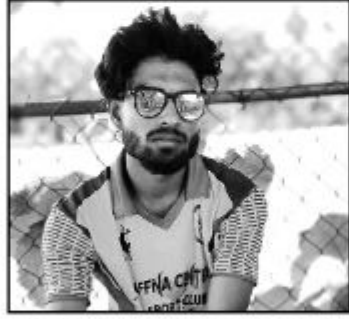
களில் சகல விக்கெட்டுக்களையும் இழந்து 243 ஓட்டங்களைப் பெற்றது.

யாழ்.கிரிக்கெட் சம்பியன் 2020 இன் மேற்படி தொடர் கடந்த 9 ஆம் திகதி ஞாயிற்றுக் கிழமை மகாஜன கல்லூரி மைதானத்தில் நடைபெற்றது. போட்டியில் யாழ்.சென்றல் அணி ரெயின்போ அணியை 5 விக்கெட்டுக்களால் வெற்றி பெற்று காலிறுதிப்போட்டிக்கு தகுதி பெற்றது. முதலில் துடுப்பெடுத்தாடிய ரெயின்போ அணி 45.2 ஓவர்