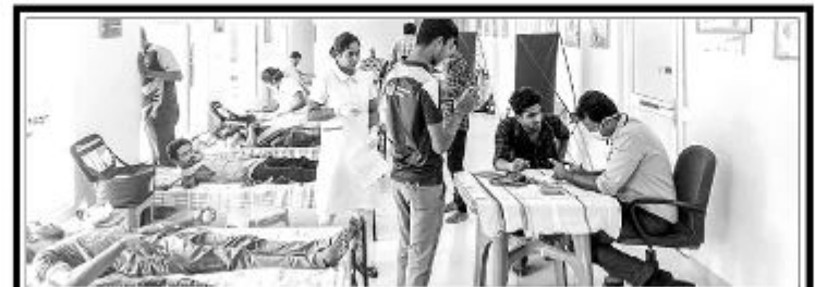
"விதையனைத்தும் விருட்சமே" குழுவும், கந்தரோடை மக்கள் முன்னேற்ற இளைஞர் கழகத்துடன் இணைந்து நடத்திய இரத்தான முகாம் கடந்த திங்கட்கிழமை கந்தரோடை சுகாதார நலன்புரி நிலையத்தில் இடம்பெற்றது.

யாழ்ப்பாண திரைப்படக் கல்லூரி திறப்பு விழா நாளை 21 ஆம் திகதி வெள்ளிக்கிழமை காலை 9 மணியளவில் இல - 15 சிறாம்பியடி லேன், ஸ்ரான்லி வீதி, யாழ்ப்பாணம் என்னும் முகவரியில் நடைபெறவுள்ளது. (5)