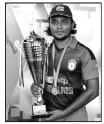
கொள்ளவுள்ளமை குறிப்பிடத்தக்கது. (4)

யும் பிரியலக்ஸன் 28 ஓட்டங்களையும் நிஸான் 26 ஓட்டங்களையும் ஜெனோஸன் 19 ஓட்டங்களையும் செஸ்ரன் 15 ஓட்டங்களையும் பெற்றனர். களத்தடுப்பில் பிரதீஸ் மற்றும் சாகித்தியன் 2 விக்கெட்டுக்களையும் சேயோன் ஒரு விக்கெட்டையும் கைப்பற்றினர். போட்டியில் வெற்றி பெற்ற சென்றலைடஸ் அணி 3 ஆவது காலிறுதிப் போட்டியில் யாழ். ஜொனியன்ஸ் அணியை எதிர்