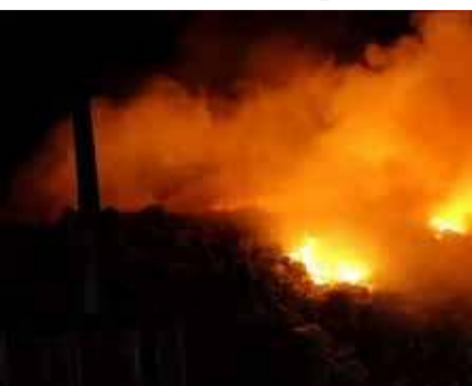
தலவத்துஓயா பொலிஸாரின் தீயிற்றுப்பட்டு மகாவலி வனப்பகுதியில் நேற்று முன்தினம்

எனப் புதன்கிழமை மாலை திடீர் தீப்பரவல் ஏற்பட்டதாகப் பொலிஸார் தெரிவித்தனர்.