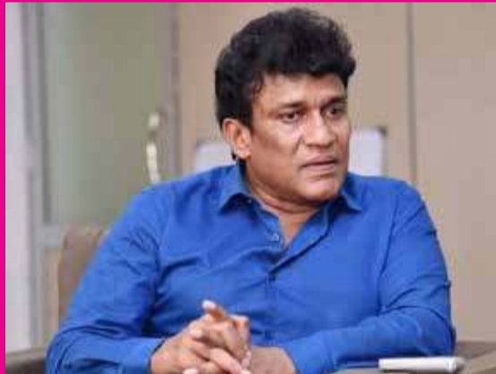
நடைபெறவுள்ள மாகாண சபைத் தேர்தலில் எந்தெந்த மாவட்டங்களில் தமிழ் முற்போக்கு கூட்டணி போட்டியிடவுள்ளதென்ற அறிவிப்பை அதன் தலை