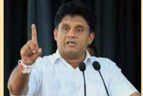
பாடுகளிலும் உங்களுக்கு அதிக அனுபவமும் உண்டு. உங்களது தலைமையில் நாடாளுமன்ற செயற்பாடுகள் பக்கச்சார்பற்ற முறையில் முன்னெடுக்கப்படும் எனத் தெரிவித்தார்.

ஜனநாயக ரீதியில் பதிவு செய்யப்பட்ட நாடாளுமன்றத்தில் ஜனநாயகம் பாதுகாக்கப்பட வேண்டும் என ஜக்கிய மக்கள் சக்தியின் நாடாளுமன்ற உறுப்பினர் சஜித் பிரேமதாஸ் தெரிவித்தார். 9ஆவது நாடாளுமன்ற அமர்வில் நேற்று (வியாழக்கிழமை) கலந்து கொண்டு உரையாற்றும்போது அவர் இதனைத் தெரிவித்தார். இதன்போது புதிய சபாநாயகர் மஹிந்த யாப்பா அபேவர்தனவிற்கு வாழ்த்து தெரிவித்து தொடர்ந்தும் உரையாற்றிய அவர், மாத்தறை ராகுல வித்தியாலயத்தில் ஆரம்பக் கல்வியை கற்ற நீங்கள் கொழும்பு பல் கலைக்கழகத்தில் பட்டத்தைப் பெற்றுள்ளீர்கள். இதேபோன்று நாடாளுமன்ற செயற்பாடுகளிலும் உங்களுக்கு அதிக அனுபவமும் உண்டு. உங்களது தலைமையில் நாடாளுமன்ற செயற்பாடுகள் பக்கச்சார்பற்ற முறையில் முன்னெடுக்கப்படும் எனத் தெரிவித்தார்.