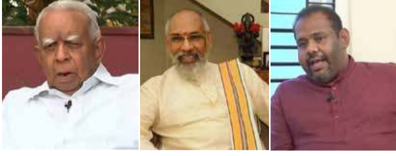
சிறிசேன, தேசிய காங்கிரஸின் தலைவர் ஏ.எல்.எம். அதாவல்லா, மக்கள் விடுதலை முன்னணியின் தலைவர் அநூர குமார திஸாநாயக்க, அகில இலங்கை மக்கள் காங்கிரஸின் தலைவர் ரிஷாத் பதியூன், தமிழீழ மக்கள்

ஸ்ரீலங்கா பொதுஜன முன்னணியின் தலைவரும் பிரதமருமான மஹிந்த ராஜபக்ஷ, ஐக்கிய மக்கள் சக்தியின் தலைவரும் எதிர்க்கட்சித் தலைவருமான சஜித் பிரேமதாஸ், தமிழ்த் தேசியக் கூட்டமைப்பின் தலைவர் இரா.சம்பந்தன், ஸ்ரீலங்கா முஸ்லிம் காங்கிரஸின் தலைவர் ரவூப் ஹக்கீம், தமிழ் முற்போக்குக் கூட்டணியின் தலைவர் மனோ கணேசன், ஈழமக்கள் ஜனநாயகக் கட்சியின் தலைவர் டக்ளஸ் தேவானந்தா, தமிழ் மக்கள் தேசியக் கூட்டணியின் தலைவர் சி.வி. விக்கினேஸ்வரன், ஸ்ரீலங்கா சுதந்திரக் கட்சியின் தலைவர் மைத்திரி பால