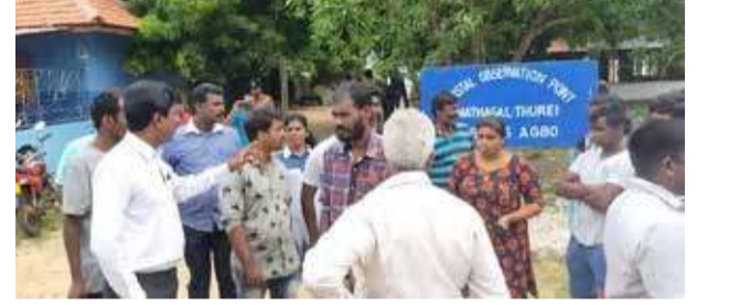
(எஸ். நிதர்ஷன்) யாழ்ப்பாணம், ஓக. 20

மாதகல் பகுதியில் அமைந்துள்ள கடற்படை முகாமுக்கு மேலதிகமாக தனியார் காணிகளைச் சுவீகரிக்க நில அளவைத் திணைக்களத்தினர் இன்று வருகை தந்தபோது அப்பகுதி மக்கள் எதிர்ப்பு ஆர்ப்பாட்டத்தில் ஈடுபட்டனர்.