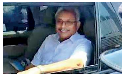
அந்த ஆர்ப்பாட்டக்காரர்: எனக்கு 38 வயதாகிறது சேர்.

ஜனாதிபதி: சரி, சரி நாங்களும் வேலை செய்திருக்கின்றோம். (ஆர்ப்பாட்டக்காரர்களில் ஒருவரைப் பார்த்து) உங்களுக்கு 45 வயதாக இருக்கமுடியுமா?