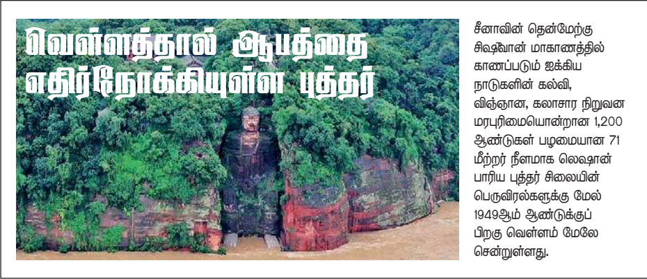
விவள்ளத்தால் ஆயுதத்தை எதிர்த்துக்கொண்டிருக்கும் புகார்

பமாகோவுக்கு வெளியேயுள்ள கடியிலுள்ள இராணுவத் தளமொன்றில் ஜனாதிபதி இப்ராஹிம் அபூபக்கர் கெய்ட்டா தடுத்து வைக்கப்பட்டிருந்த நிலையில், "இன்று ஆயுதப்படைகளின் சில மூலங்கள் அவர்களின் இடையீட்டின்மீது இவ்வாறு இது முடிவடைய வேண்டும் என விரும்பினால் உண்மையாக எனக்குத் தெரிவிப்பீர்கள்" என அங்கிருந்து ஜனாதிபதி இப்ராஹிம் அபூபக்கர் கெய்ட்டா தெரிவித்துள்ளார். குறித்த கிளர்ச்சியானது கடி முகாமின் பிரதித் தலைவரான கேணல் மலிக் டியாபா, இன்னொரு தளபதியான ஜெனரல் சாடியோ கமராவால் தலைமை தாங்கப்பட்டிருந்ததாக தெரிவிக்கப்படுகிறது. பமாகோவில் இருந்து 15 கிலோ மீற்றரளவிலுள்ள முகாமைக் கைப்பற்றிய பின்னர் கிளர்ச்சிக்காரர்கள் பமாகோவை நோக்கி அணிவகுத்துச் சென்றிருந்ததுடன், அங்கு ஜனாதிபதி இப்ராஹிம் அபூபக்கர் கெய்ட்டாவை இராஜினாமாவை வலியுறுத்துவதற்காக கூடியிருந்த சனத்திரளால் வரவேற்கப்பட்டிருந்தனர். நேற்று முன்தினம் பிற்பகலில் ஜனாதிபதி இப்ராஹிம் அபூபக்கர் கெய்ட்டாவின் வசியப்பட்டிருந்த நுழைந்த கிளர்ச்சிக்காரர்கள் அங்கிருந்த அவரையும் பிரதமர் பெளபௌ சிலேயையும் கைது செய்திருந்தனர். கிளர்ச்சியில் ஈடுபடும் படைவீரர்களின் எண்ணிக்கை தெளிவில்லாமலுள்ளது. வட மாலியின் கட்டுப்பாட்டை இஸ்லாமிய ஆயுததாரிகளும், துராக் ஆயுததாரிகளும் எடுப்பதை நிறுத்தாத சிரேஷ்ட தளபதிகளுக்கெதிராக கடந்த 2012ஆம் ஆண்டு இதே கடி முகாமில் படைவீரர்களால் கிளர்ச்சியொன்று மேற்கொள்ளப்பட்டது இராணுவக் கிளர்ச்சியொன்றுக்கு வழிவகுத்து அப்போதைய மாலி ஜனாதிபதி அமடௌ தெளமனி தூரேயை பதவியிலிருந்து அகற்றியிருந்தது.