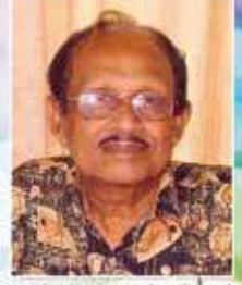
தமிழ்மன், தேசத்தின் கண்