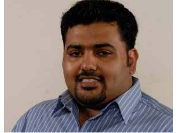
காலத்தில் பணியாற்றுவது தொடர்பிலும் விசனம் தெரிவிக்கப்படுகின்றது.

- ஆகிய இரு முக்கிய விடயங்கள் உள்ளடங்கலாக கடிதம் அனுப்பி வைக்கப்பட்டமை தொடர்பில் மாவட்டச் செயலகத்தில் கடும் அதிருப்தி தெரிவிக்கப்படுவதோடு, இத்தகைய அரசியல் அழுத்தத்துக்கு மத்தியில் எதிர்