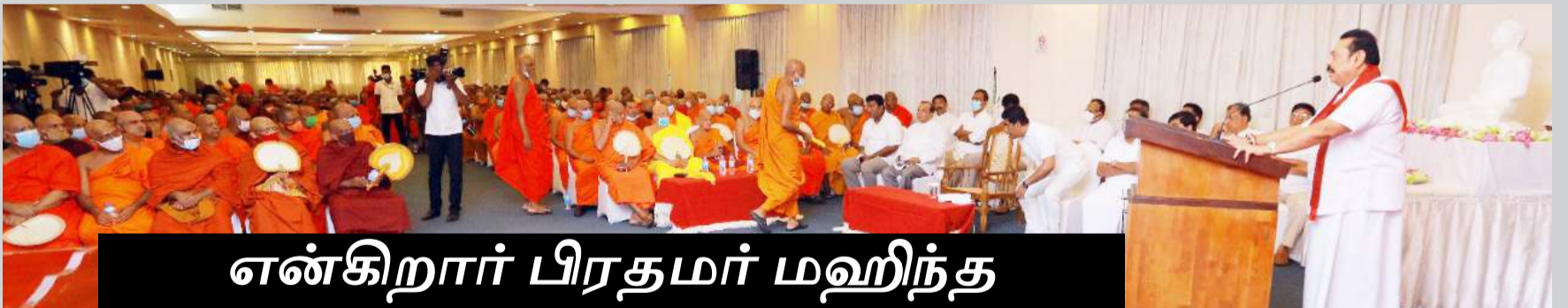
என்கிறார் பிரதமர் மஹிந்த

அனைத்து இனங்கள் மற்றும் மதங்களை சமமாகக் கருதுவதுடன், பௌத்த மதத்திற்கு அரசமைப்பில் வழங்கப்பட்டுள்ள இடத்தை பாதுகாப்பதற்கு அர்ப்பணிப்புடன் செயற்படுவோம் என பிரதமர் மஹிந்த ராஜபக்ஷ தெரிவித்துள்ளார்.