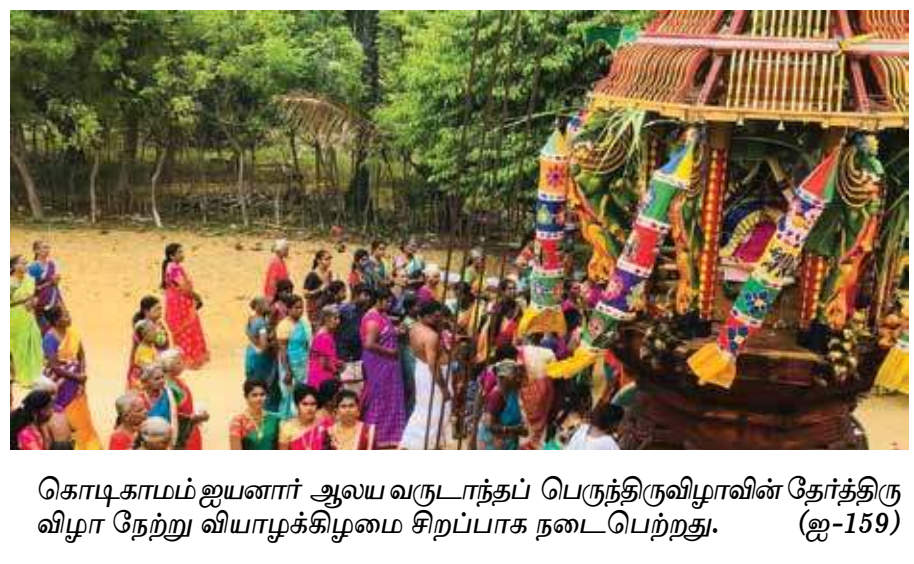
கொடிகாமம் ஐயனார் ஆலய வருடாந்தப் பெருந்திருவிழாவின் தேர்த்திருவிழா நேற்று வியாழக்கிழமை சிறப்பாக நடைபெற்றது. (ஐ-159)