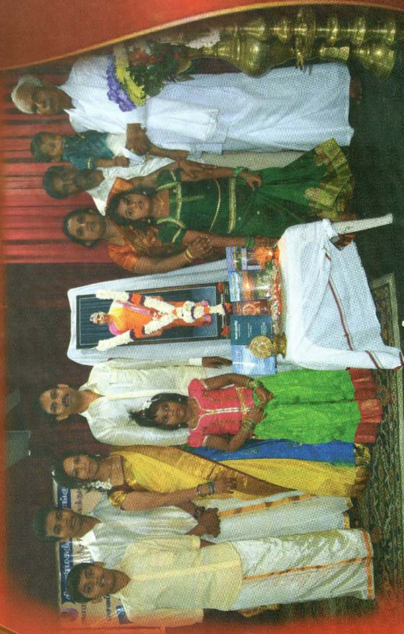
சீவகாண்டந்தர் செல்வத்துரைன் வம்ச வீடுசங்கர்