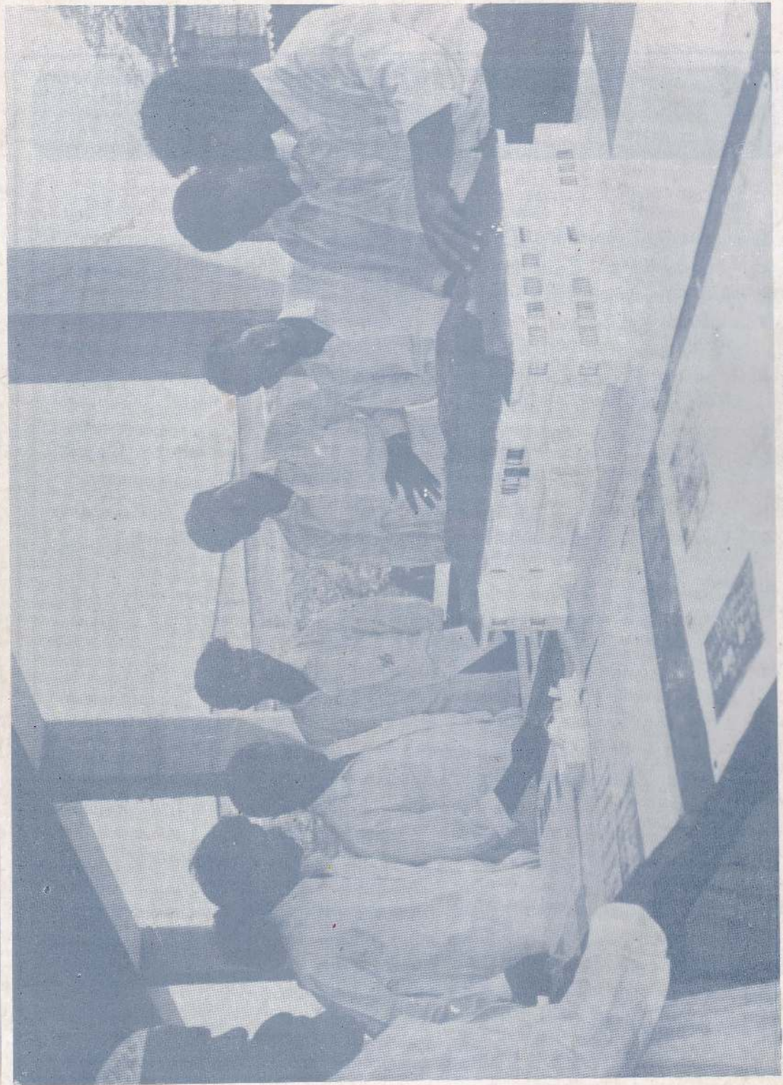
முத்தளம் இப்னு பதூதா ஹோலில் 31.10.95ல் N.M.R.O ஏற்பாடு செய்த கண்காட்சியில் எருக்கலாண்டி மத்திய கல்லூரியை யோது மக்கள் பார்வையிடுவதையும் அதை அமைத்த நிகரர் ஹிதரயதல்லாஹிஷம் அருகில் காணப்படுகிறார்.

அகதி இதற் 15A, ரோஹினி வீதி, கொழும்பு 6 வடக்கு முஸ்லிம்களின் உரிமைக்கான அமைப்பினரால் ஏ.ஜே. யிரிள்ட்ஸ் இல, 1B பீ.பி.டி சில்வா மாவத்தை, தெஹிவனையிள் அச்சிட்டு வெளியிடப்பட்டது.