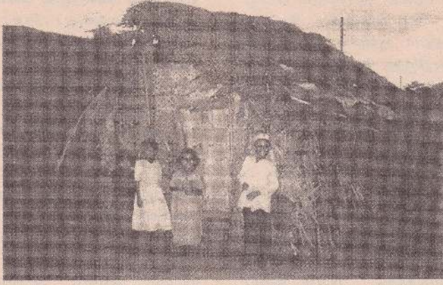
வடக்கு முஸ்லிம்கள் அகதிகளாக வாழ்ந்து வரும் நொச்சியாகம அகதி முகாமின் இன்றைய தோற்றம்