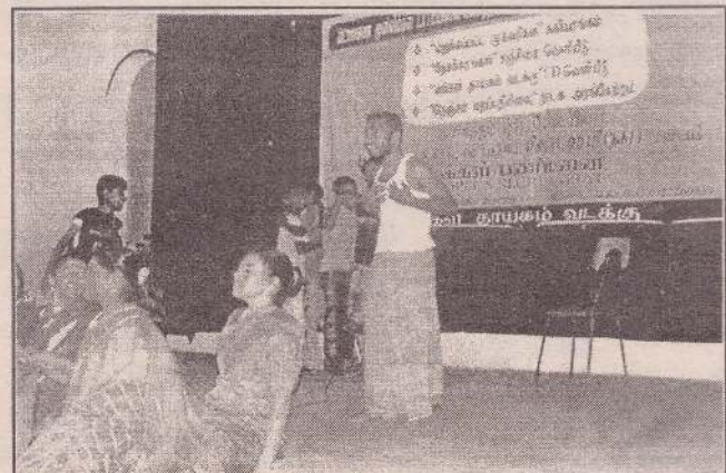
வடபுல முஸ்லிம்களின் பலவந்த வெளியேற்றத்தின் 16வது வருட நினைவு நிகழ்ச்சிகளில் அரங்கேற்றப்பட்ட "நெஞ்சம் மறப்பதில்லை" எனும் நாடகத்தின் போது.

எனவே பெரும்பான்மையினர் வரலாற்றிலிருந்து பாடம் படித்து நாட்டுக்கு நல்லது செய்வதற்கு பதிலாக தனியே சிங்கள சமூகத்துக்கு மாத்திரம் நன்மை செய்து நாட்டுக்கு தீமை செய்து கொண்டிருக்கிறார்கள். நாட்டின் மேல் ஏற்படும் தீமைகள் சிங்களவர்களுக்கும் பாதிப்பை ஏற்படுத்தும் என்பதனை உணராது நாளை ஆட்சியை எப்படிப் பிடிக்கலாம் என்று சிந்தித்து சிங்களவர்களின் உணர்வுகளுக்கு தீணி போட்டுக் கொண்டிருக்கின்றார்கள். இந்த சூழ்நிலை சிந்தனை மாறாத வரையில் நாட்டில் சமாதானத்தைக் காண முடியாது