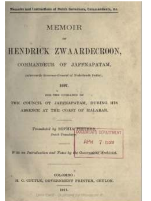
ஹென்றிக் சுவார்டெக்குரூனின் வழிகாட்டற் குறிப்பு

ஹென்றிக் சுவார்டெக்குரூன் நெதர்லாந்தின் ரொட்டர்டாமைச் சேர்ந்தவர். பிரபுத்துவக் குடும்பத்தில் பிறந்த இவர் ஒல்லாந்தக் கிழக்கிந்தியக் கம்பனியின் படையில் சேர்ந்து பத்தேவியாவுக்குச் சென்றார். அங்கே சிவில் சேவையில் சேர்ந்து பல்வேறு படிநிலைகளிற் பணியாற்றி வேகமாக முன்னேறினார். 1694 ஆம் ஆண்டு இவர் கட்டளை அதிகாரியாகப் பதவி உயர்வு பெற்று யாழ்ப்பாணத்துக்கு வந்தார். 1697 இல் இந்தியாவுக்கு அழைக்கப்பட்ட இவர் பல்வேறு உயர் பதவிகளை வகித்து 1718 ஆம் ஆண்டில் ஒல்லாந்த இந்தியாவின் ஆளுனர் நாயகம் ஆனார். 1724 ஆம் ஆண்டுவரை இப்பதவியை வகித்த சுவார்டெக்குரூன் ஓய்வுபெற்றுக்கொண்டு தனது இறுதிக் காலத்தைப் பத்தேவியாவில் கழித்தார். யாழ்ப்பாணத்துக் கட்டளை அதிகாரிகளின் வழிகாட்டற் குறிப்புகளில் சுவார்டெக்குரூனின் குறிப்பு மிகவும் பெறுமதி வாய்ந்ததாகக் கருதப்படுகின்றது. இதுபோன்ற பிறவற்றோடு ஒப்பிடும்போது, யாழ்ப்பாணக் கட்டளையகம் தொடர்பில் மிகவும் விரிவானதும், முக்கியமான பல தகவல்களைக் கொண்டதுமான ஆவணமாக இது விளங்குகின்றது. இதற்குப் பிந்திய ஒல்லாந்தர் ஆட்சிக்காலம் முழுவதிலும் அதிகாரிகள் இவ்வழிகாட்டற் குறிப்பை உசாத்துணையாகவும், மேற்கோள் காட்டுவதற்கும் பயன்படுத்தியுள்ளனர் என்பது இதன் முக்கியத்துவத்தை உணர்த்துகின்றது. இதன் ஆங்கில மொழிபெயர்ப்பு 1911 ஆம் ஆண்டில் வெளியானது.