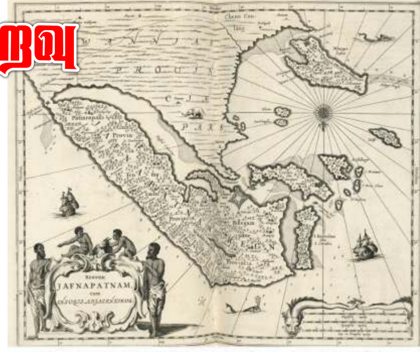
யாழ்ப்பாணக் கட்டளையகத்துள் அடங்கும் பகுதிகளைக் காட்டும் நிலப்படம்

ஹென்றிக் சுவார்டெக்குரூன் நெதர்லாந்தின் ரொட்டர்டாமைச் சேர்ந்தவர். பிரபுத்துவக் குடும்பத்தில் பிறந்த இவர் ஒல்லாந்தக் கிழக்கிந்தியக் கம்பனியின் படையில் சேர்ந்து பத்தேவியாவுக்குச் சென்றார். அங்கே சிவில் சேவையில் சேர்ந்து பல்வேறு படிநிலைகளிற் பணியாற்றி வேகமாக முன்னேறினார். 1694 ஆம் ஆண்டு இவர் கட்டளை அதிகாரியாகப் பதவி உயர்வு பெற்று யாழ்ப்பாணத்துக்கு வந்தார். 1697 இல் இந்தியாவுக்கு அழைக்கப்பட்ட இவர் பல்வேறு உயர் பதவிகளை வகித்து 1718 ஆம் ஆண்டில் ஒல்லாந்த இந்தியாவின் ஆளுனர் நாயகம் ஆனார். 1724 ஆம் ஆண்டுவரை இப்பதவியை வகித்த சுவார்டெக்குரூன் ஓய்வுபெற்றுக்கொண்டு தனது இறுதிக் காலத்தைப் பத்தேவியாவில் கழித்தார். யாழ்ப்பாணத்துக் கட்டளை அதிகாரிகளின் வழிகாட்டற் குறிப்புகளில் சுவார்டெக்குரூனின் குறிப்பு மிகவும் பெறுமதி வாய்ந்ததாகக் கருதப்படுகின்றது. இதுபோன்ற பிறவற்றோடு ஒப்பிடும்போது, யாழ்ப்பாணக் கட்டளையகம் தொடர்பில் மிகவும் விரிவானதும், முக்கியமான பல தகவல்களைக் கொண்டதுமான ஆவணமாக இது விளங்குகின்றது. இதற்குப் பிந்திய ஒல்லாந்தர் ஆட்சிக்காலம் முழுவதிலும் அதிகாரிகள் இவ்வழிகாட்டற் குறிப்பை உசாத்துணையாகவும், மேற்கோள் காட்டுவதற்கும் பயன்படுத்தியுள்ளனர் என்பது இதன் முக்கியத்துவத்தை உணர்த்துகின்றது. இதன் ஆங்கில மொழிபெயர்ப்பு 1911 ஆம் ஆண்டில் வெளியானது.