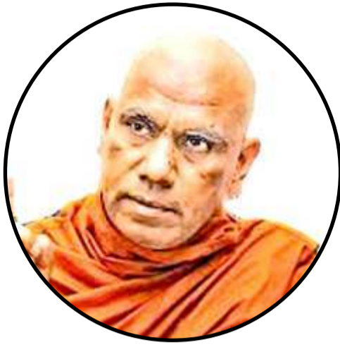
சமிக்ளைகளை காட்ட ஆரம்பித்தது எனலாம்.

அரசு பௌத்தத்திற்கு முதலிடம் என வெளிப்படையாகப் பிரகடனம் செய்த போதே இலங்கை, அதாவது ஸ்ரீலங்கா ஒரு சோஷலிசக் குடியரசு என்று கூறிக் கொள்ளும் தகுதியை இழந்துவிட்டது என்பதே உண்மை. பௌத்தத்திற்கு முதலிடம் எனக் கருதிக் கொண்ட தனாலோ என்னவோ, அரசு நிர்வாகத்தின் சகல துறைகளுக்கும் தேரர்களின் கருத்தியல் ஆதிக்கம் கோலோச்சத் தொடங்கிவிட்டது. ஆசீர்வாதம் செய்ய வேண்டிய தேரர்கள், அதிகாரம் செய்பவர்களாகத் தம்மை நினைத்துச் செயற்படத் தொடங்கியது என்பது இந்த நாடு சந்திக்கப்போகும் எதிர்கால நெருக்கடிகள் குறித்த எச்சரிக்கை