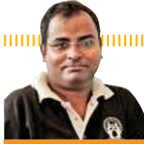
தெ. ஞானலீர்தி மீநிலங்கோ