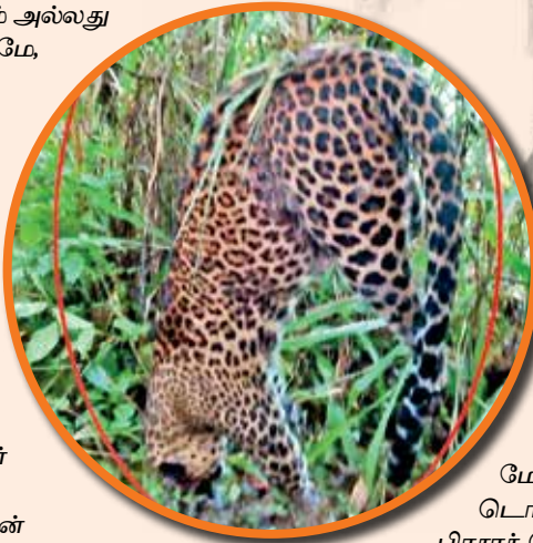
மேற்கொண்ட டொக்டர் தாரக்க பிரசாத் தெரிவித்திருந்தார்.

இந்நிலையில், இலங்கையில், சிறுத்தைகள் இறப்பதற்கு, பொறி வைப்பதே பிரதான காரணமாக அமைந்துள்ளது.