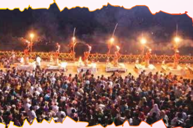
பாரதபூமியில் உள்ள பன்னிரண்டு ஜோதிர்லிங்க

காசி எனவும் வாரணாசி எனவும் பெயர் கொண்ட பனாரஸ் நகரம் பாரத நாட்டு மக்கள் போற்றும் முக்தித் தலங்கள் எழில் ஒன்றாகப் போற்றப்படுகின்றது. காசி என்றால் ஒளிமயம் - வெளிச்சக்குவியல் என்று பொருள் கூறப்படும். ஐம்பத்து நான்கு சிவன் கோவில்களும், ஐம்பத்து நான்கு சக்தி கோவில்களும் இங்கு அமைந்திருந்ததாகவும், பெரும் சக்தி வாய்ந்த எந்திரங்களால் ஸ்தாபனமான பெரும் வெளிச்சத் தூண், சிவபிரானின் அடி முடி தேடியபோது உருவாக்கப்பட்டதாகவும் புராணங்களில் கூறப்படுகின்றது. காசிக்கு வடக்கே வாரணாசி ஆறும், தெற்கே அசி என்ற ஆறும் கங்கையில் சங்கமம் ஆவதால் வாரணாசி என்றும் பெயர் பூண்டுள்ளது. பண்டு ஒரு காலம் பனாரஸ் எனும் அரசனால் புதுப்பிக்கப் பட்டமையால் பனாரஸ் எனவும் பெயர் பெற்றது. மேலும் இந்நகரம் ஆனந்தவனம், பூலோக கைலாயம், மகாமயானம், அவிமுத்தம் என்றெல்லாம் அழைக்கப்படுகின்றது. வைணவ மதப்பிரிவினர் காசித்தலத்தை பிந்துமாதவ சேத்திரம் என்று குறிப்பிடும் வழக்கம் உண்டு.